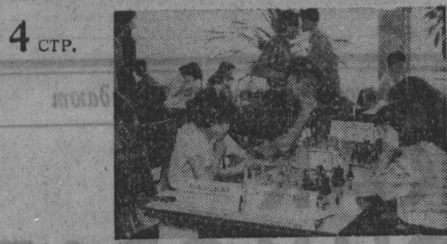
Сибирь давно уже перестала быть шахматной периферией. Многие сильные шахматисты имеют сибирскую прописку. О недавних турнирах, о перспективах развития шахмат в регионе рассказывает на странице «Дебют».