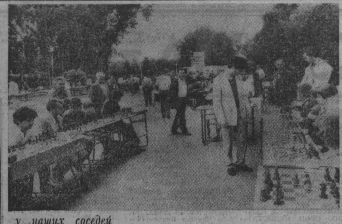
у наших соседей

В Новокузнецке проводится крупный международный турнир юных шахматистов.