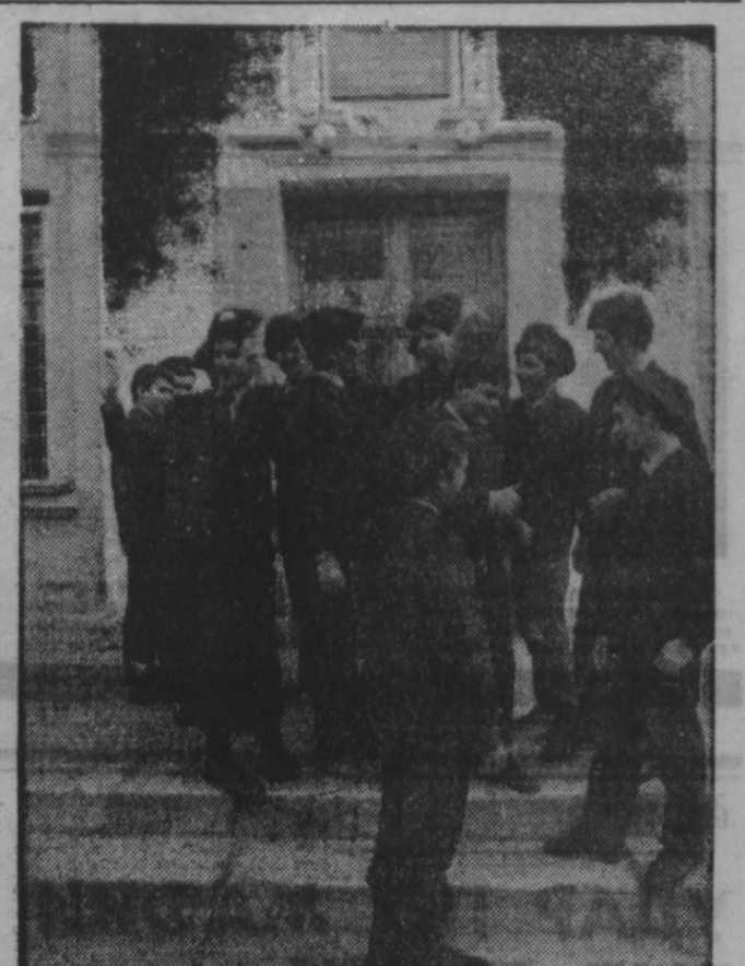
и выставочные залы, проводятся экскурсии с интересными людьми.

жатся на полном государственном обеспечении. Для них разработана форма одежды единого образца. Курс обучения рассчитан на 6 классов — с 7-го по 12-й. После завершения обучения выдается аттестат о среднем образовании. Колледж, которое позволяет поступить в высшие учебные заведения МВД без вступительных экзаменов. Весь этап обучения рассчитан не только на воспитание профессионалов, но и всестороннее развитие личности: проводятся экскурсии в музеи