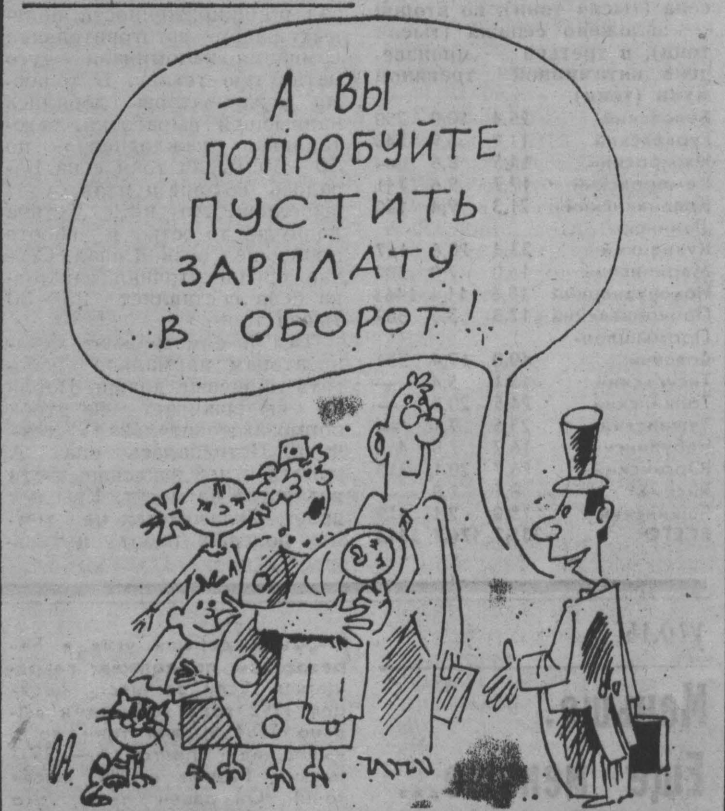
Рис. А. Левитина.