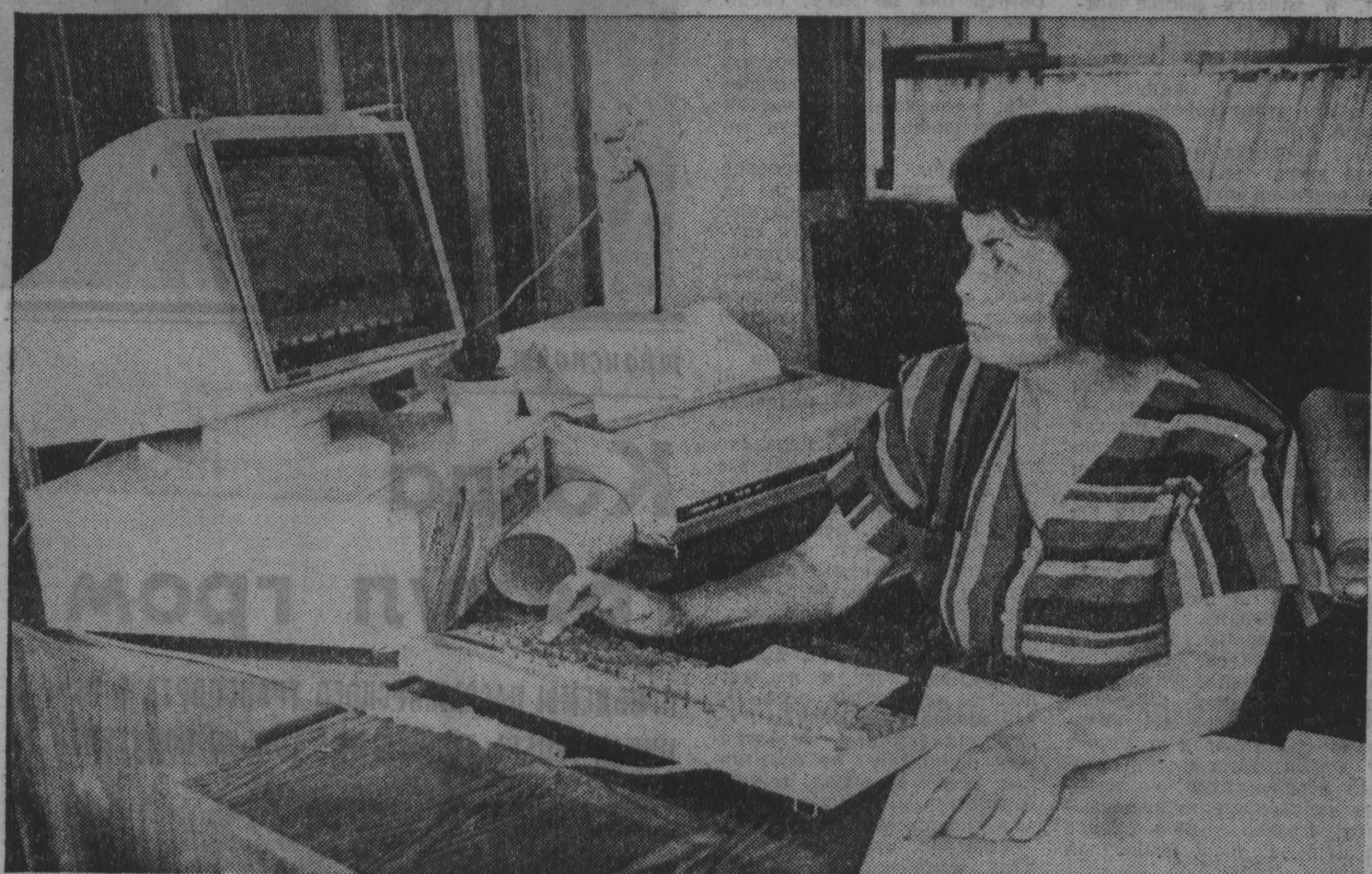
государственной статистике ~ 150 лет

Центр по гидрометеорологии сообщает: 24 июля по области будет переменная облачность, местами небольшие кратковременные дожди, грозы. Ветер переменный. Температура 22-25 градусов тепла. Угроза местами туман. Дневная влажность существенно не изменится.