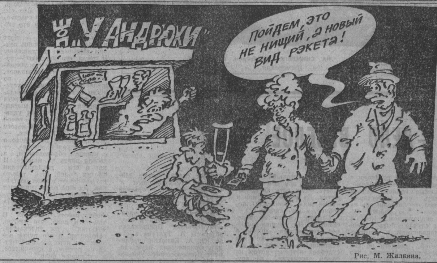
Рис. М. Жалкина.

рому категорически запрещается торговля водкой без лицензий. А они будут выдаваться только магазинам с соответствующим оборудованием помещениями. Торговля алкогольной продукцией разрешена с 11 до 19 часов. Владелец ларьков, павильонов, установленных без разрешения администрации, предложено убрать их в недельный срок. Павильоны должны быть в течение недели перенесены на территории городского рынка и в другие специально отведенные места. Переселение уже началось. Многие жители выражают недовольством властям свою благодарность. Ю. МИХАЙЛОВ. г. Березовский.