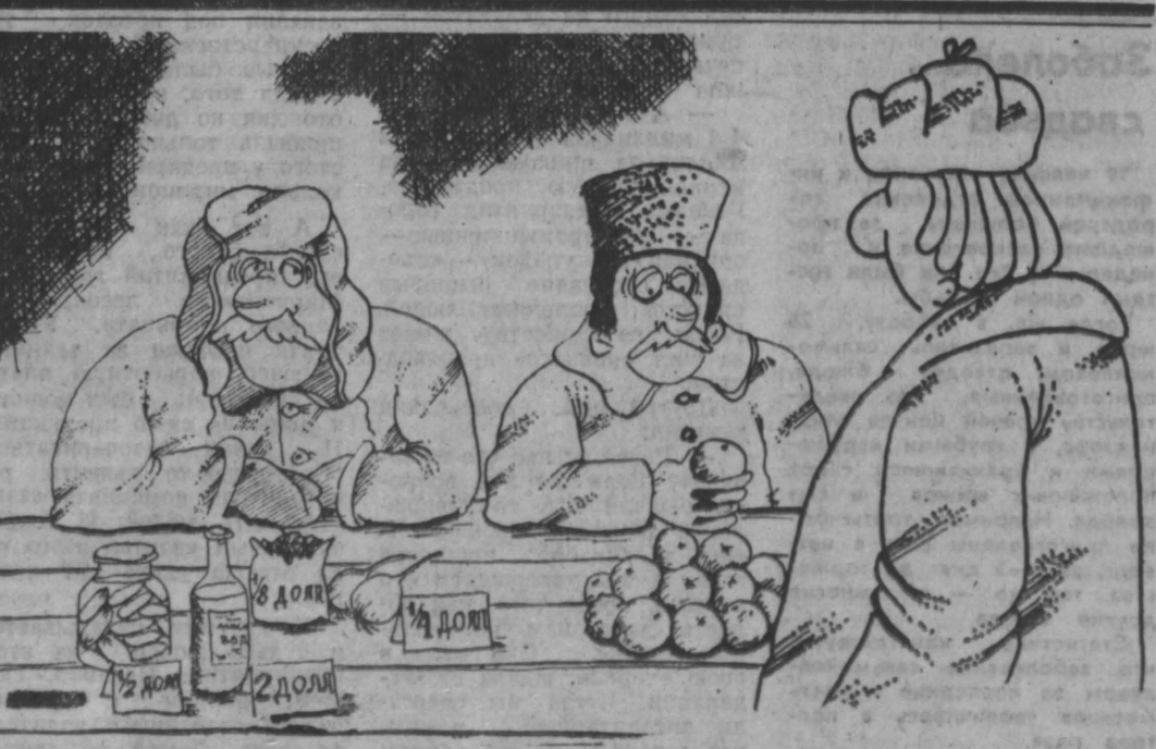
Рис. Н. Астраханцева.

В эти дни по области будет переменная облачность, местами по югу дождь, гроза, ветер переменный, слабый. Температура 24—29 градусов тепла. Давление и влажность существенно не изменятся.