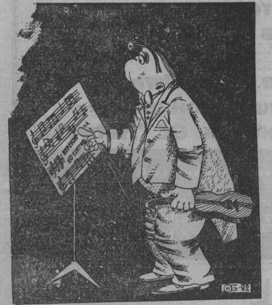
Рис. Н. Астраханцева.