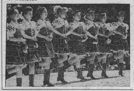
НА СНИМКАХ: фрагменты праздника.