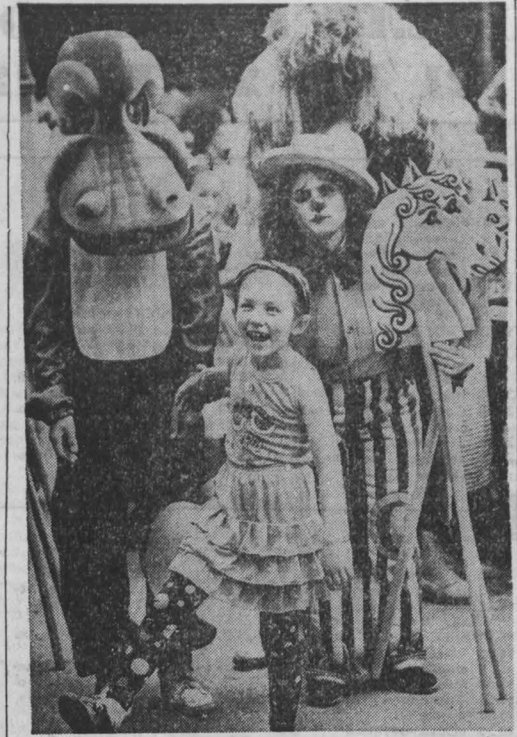
«Город — детям» — так назывался детский праздник, прошедший недавно в городском саду областного центра. Провели и организовали его отделе социальной защиты, культуры и народного образования администрации города...

ГАЗЕТА «КУЗБАСС» ЧЛЕН ПЕНСИОННОГО ОБЩЕСТВА РАССОЛОВОЙ РАБОТЫ. Адрес: Кемерово, пр. Октябрьский, 28. Контактная информация.