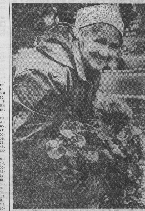
город и мы