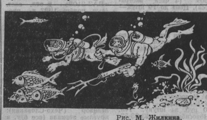
Рис. М. Жигина.