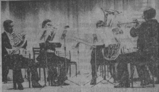
На этом снимке — брас-виньет концертного духового оркестра. Этот ансамбль в числе других принял участие в последнем в родных стенах перед гастролями в Германии концерте кузбасских музыкантов. Подробности в публикации «Пусть жалуют те, кто не пришел».

3 стр. Еще в недавние времена предстоящее воскресенье отмечалось как День медицинского работника. Редакция газеты посвящает этому событию материалы третьей страницы сегодняшнего выпуска.