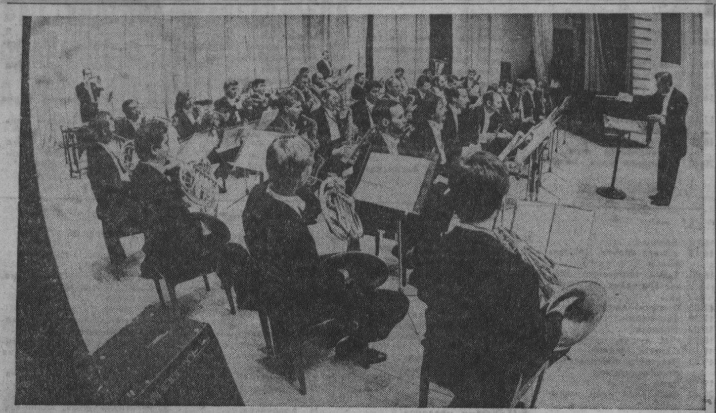
Фот. А. Блотникова, Г. Кемерово.

Сегодня, когда вы держите в руках этот номер «Кузбасса», музыканты Кузбасского симфонического оркестра дают свой первый концерт на гастрольных площадках в Германии. Напряженным было время подготовки к этому ответственному зарубежному турне. До прецедента был уплотнен график репетиций, ведь по просьбе приглашающей стороны в программу гастрольных концертов включены произведения, которые ранее оркестр не исполнял. Но даже в столь напряженные дни музыканты духового оркестра, входящего в состав симфонического, презрев отдых, готовились к последнему своему концерту перед отъездом в Германию в родных стенах Большого зала филармонии. Этот концерт состоялся, хотя чуть ли не до последнего момента было не ясно, выйдут ли в этот вечер музыканты на сцену. Причина такого введения дня обидного проста: у-