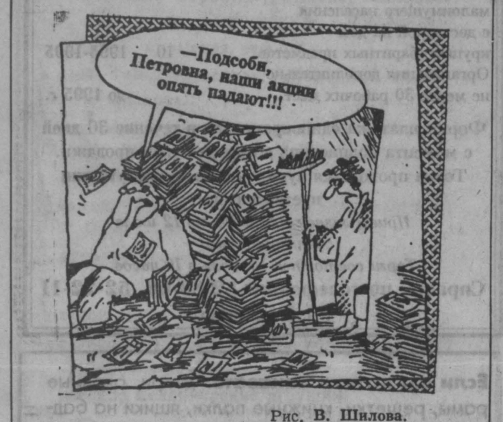
Рис. В. Шилова.