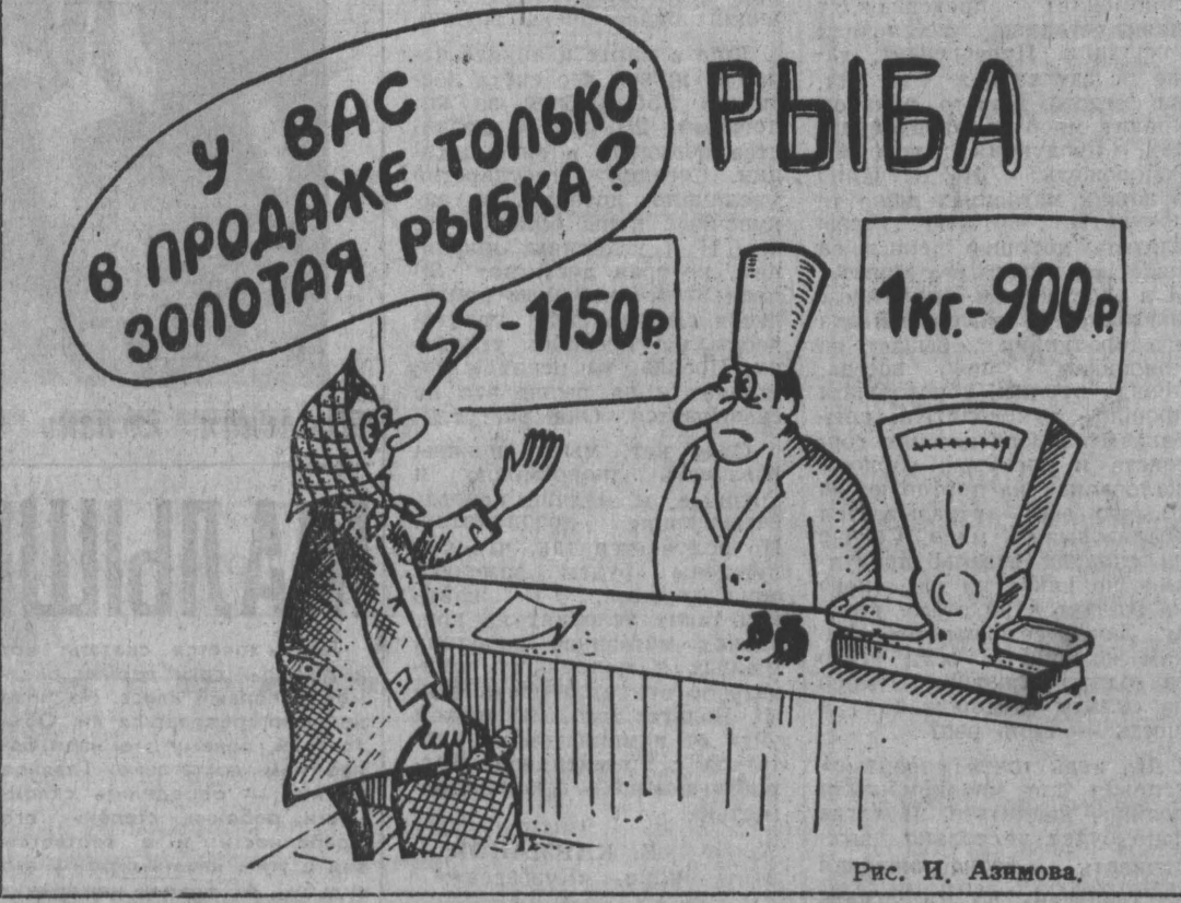
Рис. Н. Азимова.