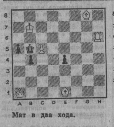
Мат в два хода.