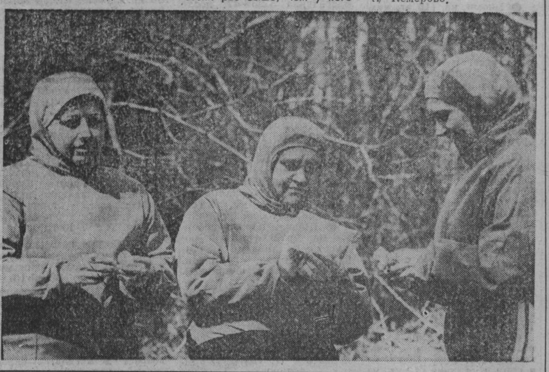
Фот. Ю. Юрьев, г. Кемерово