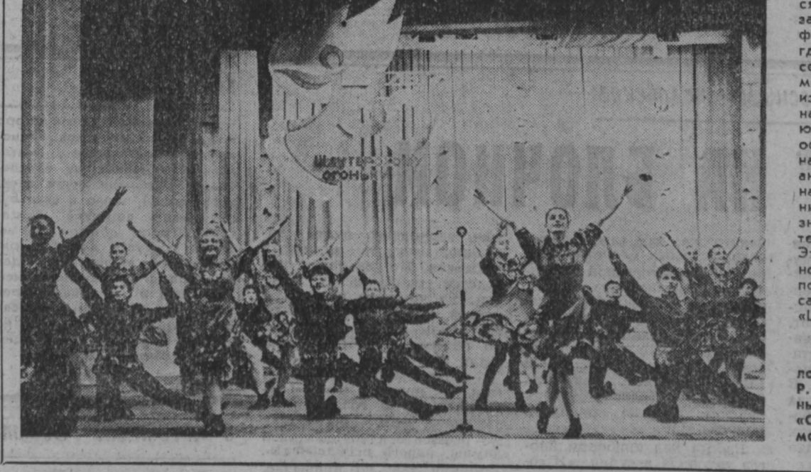
Фото А. Блотницкого.

НА СНИМКАХ: перед началом праздника рядом с Р. Тихенко — полпреды разных поколений танцоров «Огонька» на сцене — вечно молодая «Калинка». Фото А. Блотницкого.