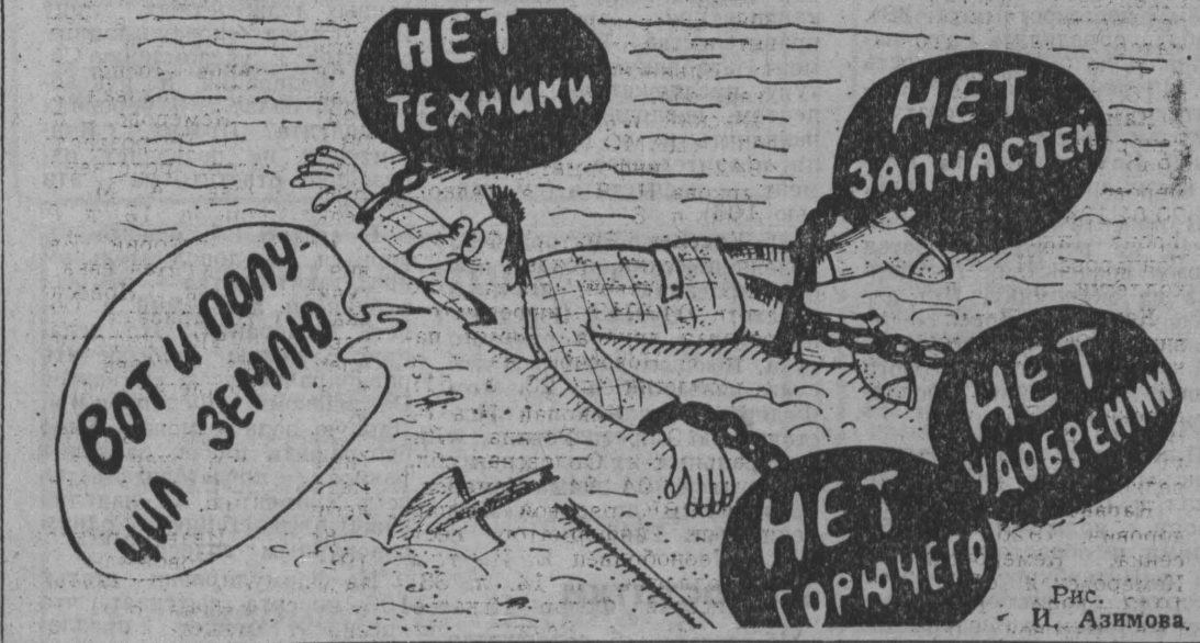
Рис. И. Аизхова.