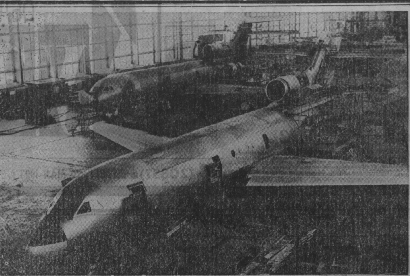
6 XXI век

Предлагаемую форму правления нельзя назвать парламентской республикой, так как президент связан необходимостью согласовать свои решения с премьером и правительством (называемая «контрасигнатурой»). Вынужден констатировать, что Россия в очередной раз «пошла своим путем».