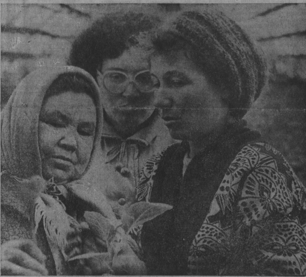
Фото В. Грызыкина, Кемеровский район.

Союз «Береговая», как и многие хозяйства области, переживает нинешнее лето в трудных условиях. Весенние работы сегодня приостановлены из-за непогоды. Но не только небеса виноваты в загибе на полях. На 300 гектарах сокращены посадочные площади различных овощных культур. А отурпы, укроп, петрушка, кабачки, редька, лук вообще нинше исчезли с полей союза, а следовательно, и с прилавков магазинов. Кроме этого, овощные базы областного центра запросили нинешнее количество картофеля, свеклы, моркови. Глядя на цифры, думаешь: кто и как думает кормить население в течение долгой зимы! В эти дни в восьми теплицах союза уже подготовлена рассада капусты для посадки на 160 гектарах.