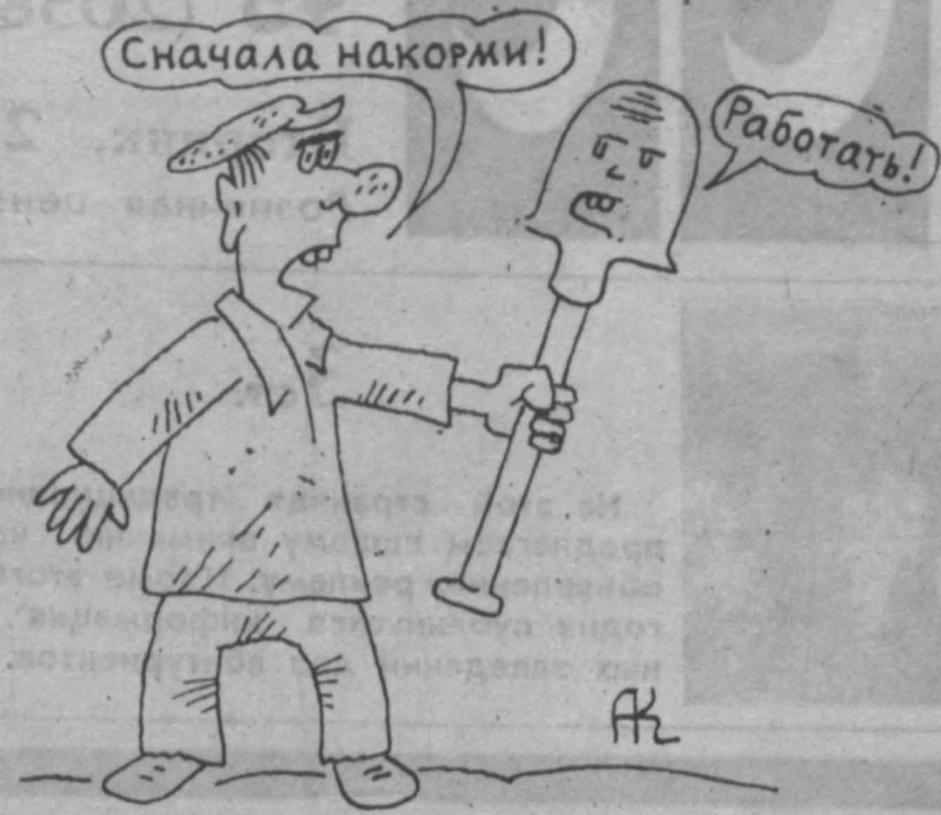
Рис. А. Климана.