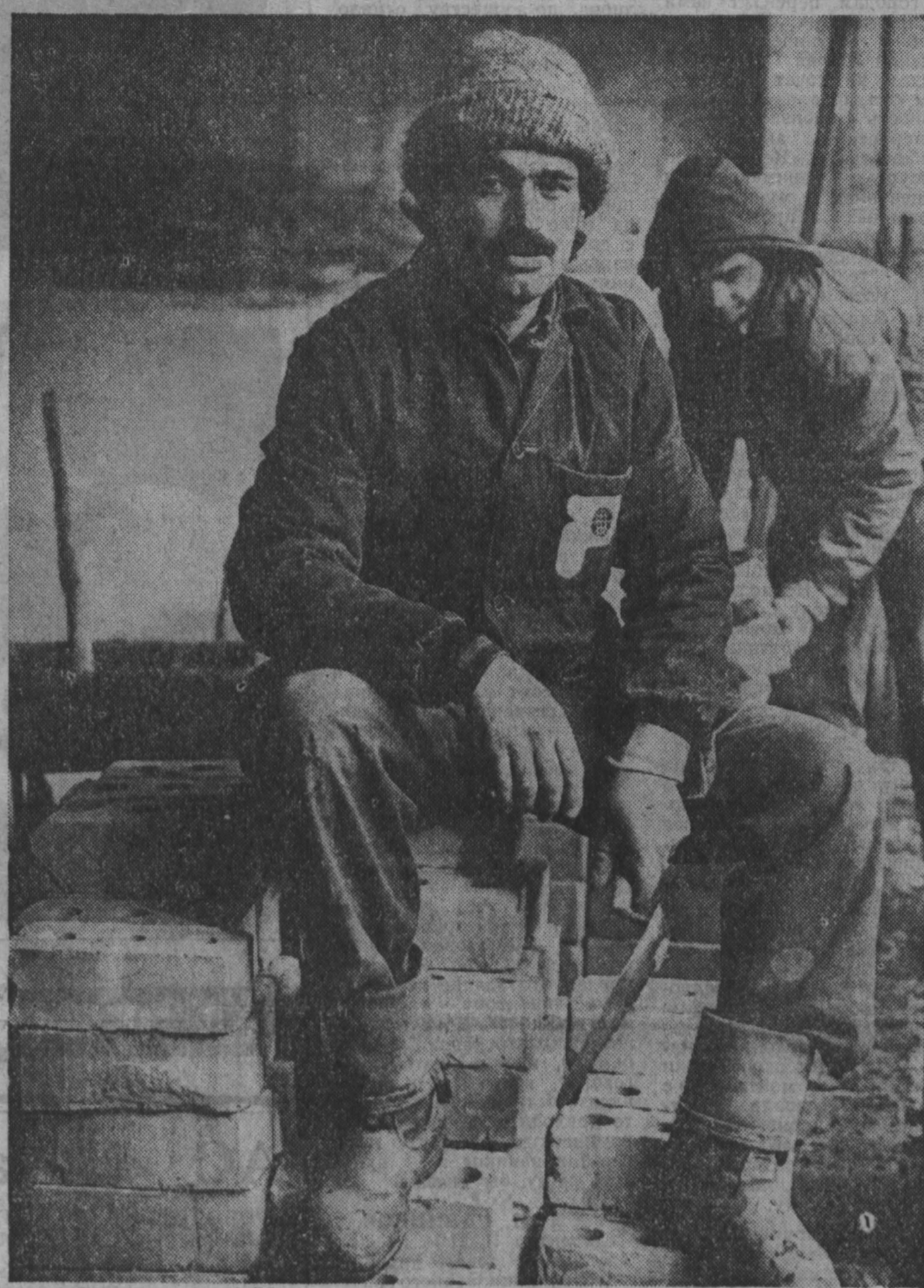
Строительство хирургического корпуса больницы № 29 ведут рабочие турецкой строительной компании «Теконтур». Контракт с иносферной заключен Западно-Сибирским металлургическим комбинатом. Окончание строений намечено на декабрь 1993 года. Хирургический корпус, площадь которого достигает 45 тысяч квадратных метров, во многом поможет решить проблемы медицинского обслуживания жителей юга Кузбасса.