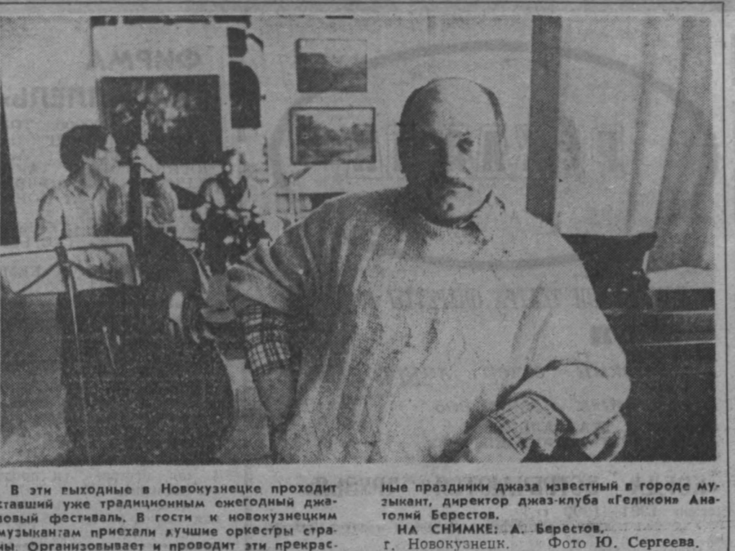
В эти выходные в Новокузнецке проходит традиционный ежегодный джазово-симфонический фестиваль. В гостях к новокузнецким музыкантам приехали лучшие оркестры страны. Организует и проводит эти прекрасные праздники джаз-клуб «Геликон» Новокузнецка.