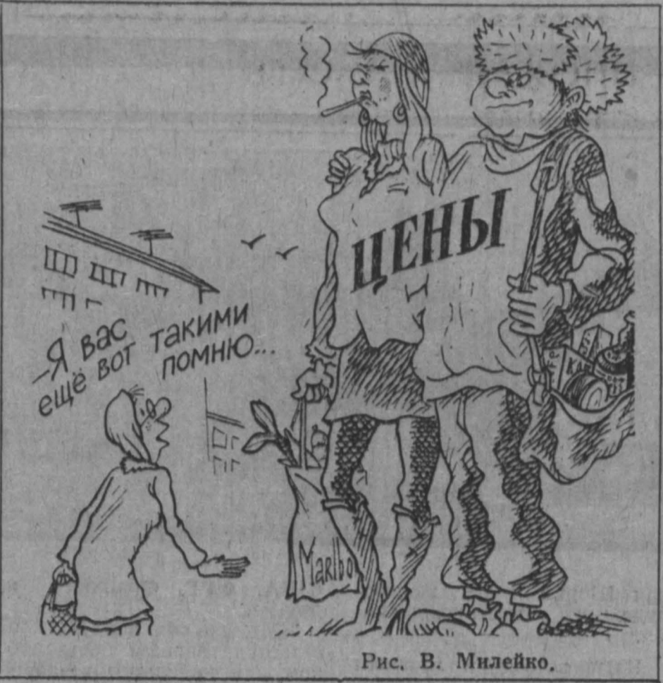
Рис. В. Милейко.