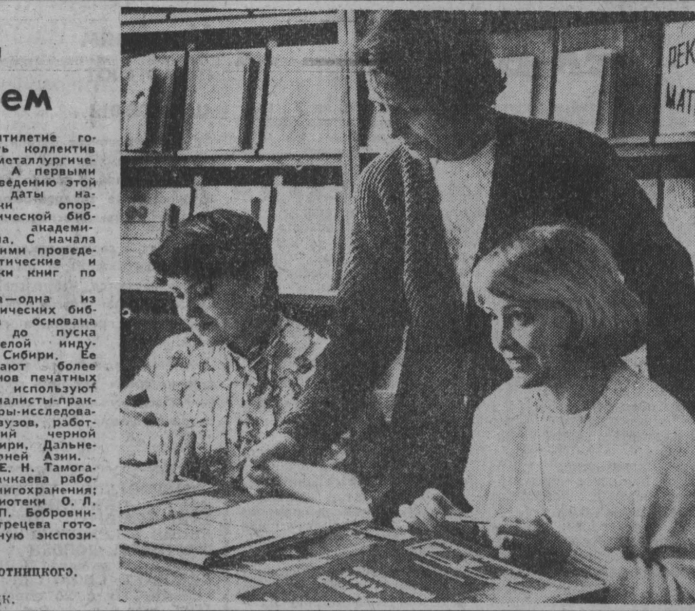
г. Новокузнецк.