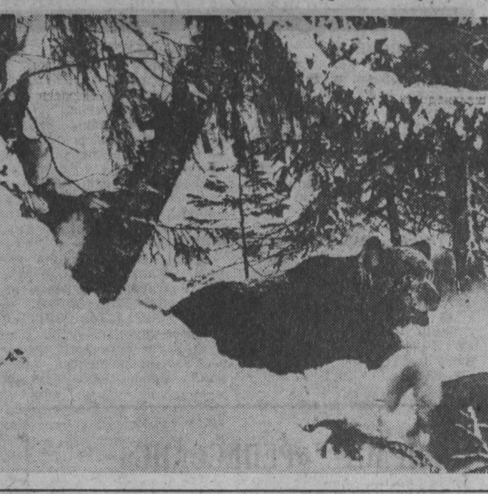
Ю. СЕРГЕЕВ, А. БЛОТНИЦКИЙ.

на СНИМКАХ: Геннадий Егорович с сыном Егоркой: охотничьи сюжеты.