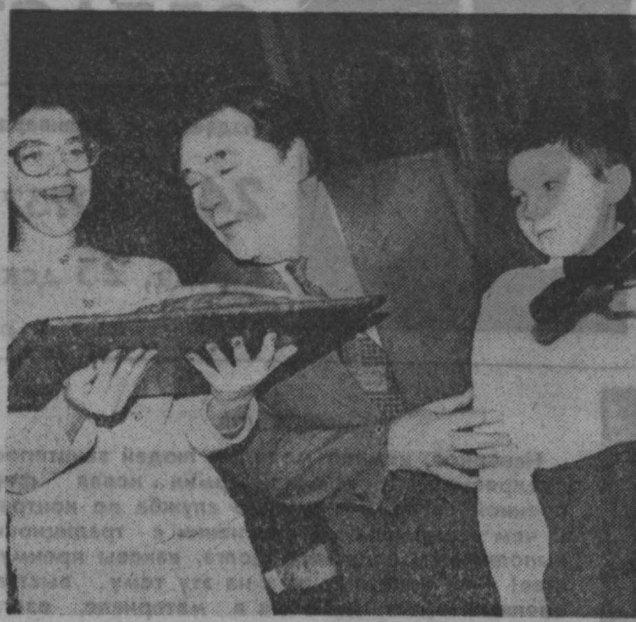
КузПИ — один из главных учреждений гимназии — оказал большую помощь и участие в организации праздника. Недавно между первыми руководителями двух этих учебных заведений был подписан договор о взаимном сотрудничестве. На презентации присутствовали спонсоры — представители производственного объединения «Азот» и «Сибхимэнерго». В честь праздника администрация города преподнесла гимназии подарок — 12 янских швейных машин. Для 450 мальчишек и девочек этот день надолго сохранится в памяти и своей торжественностью, и выступлениями артистов студенческого клуба, и приятным клятвы гимназистов, и угостением — сладкими пироженками. Отныне учащиеся школы № 23 будут именоваться гимназистами. М. ГОРИЮШИНА.

Никогда еще стенам Кузбасского политехнического института не приходило видеть такого звонкоглаголого и шумного народа. И студенты, и седые профессора с удивлением смотрели на резвящихся и разодетых в бирюзовую форму малышей и степенных в белоснежных блузах старшеклассников. Зато те с любопытством оглядывали высокие потолки, заглядывали в аудиторию, по-хозяйски расхаживали по коридорам и с удовольствием усаживались в широкие кресла автового зала, который — тоже впервые — встречал таких гостей. В этот день все было впервые. Впервые студенческий гимн «Гаудемус» был исполнен в этом храме науки первокурсниками. Впервые преподаватели института могли посмотреть на своих будущих студентов 2002 года — сегодня еще второклассников первой в городе Кемерово политехнической гимназии. Ее день рождения и пришло отмечать ребята. А