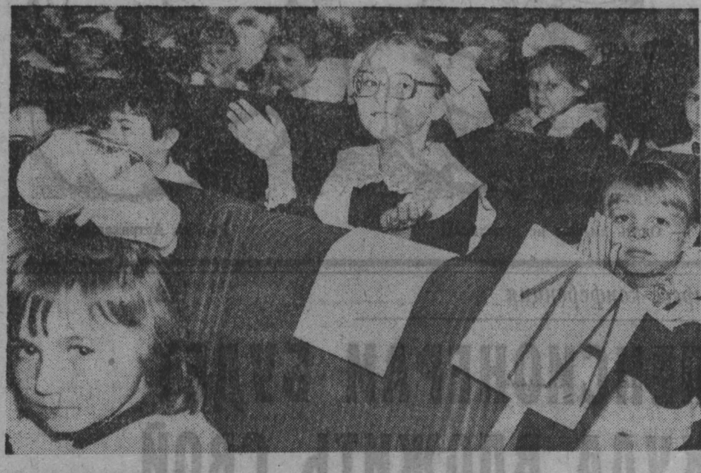
«Кузбасс» 2023 декабря 1992 г.