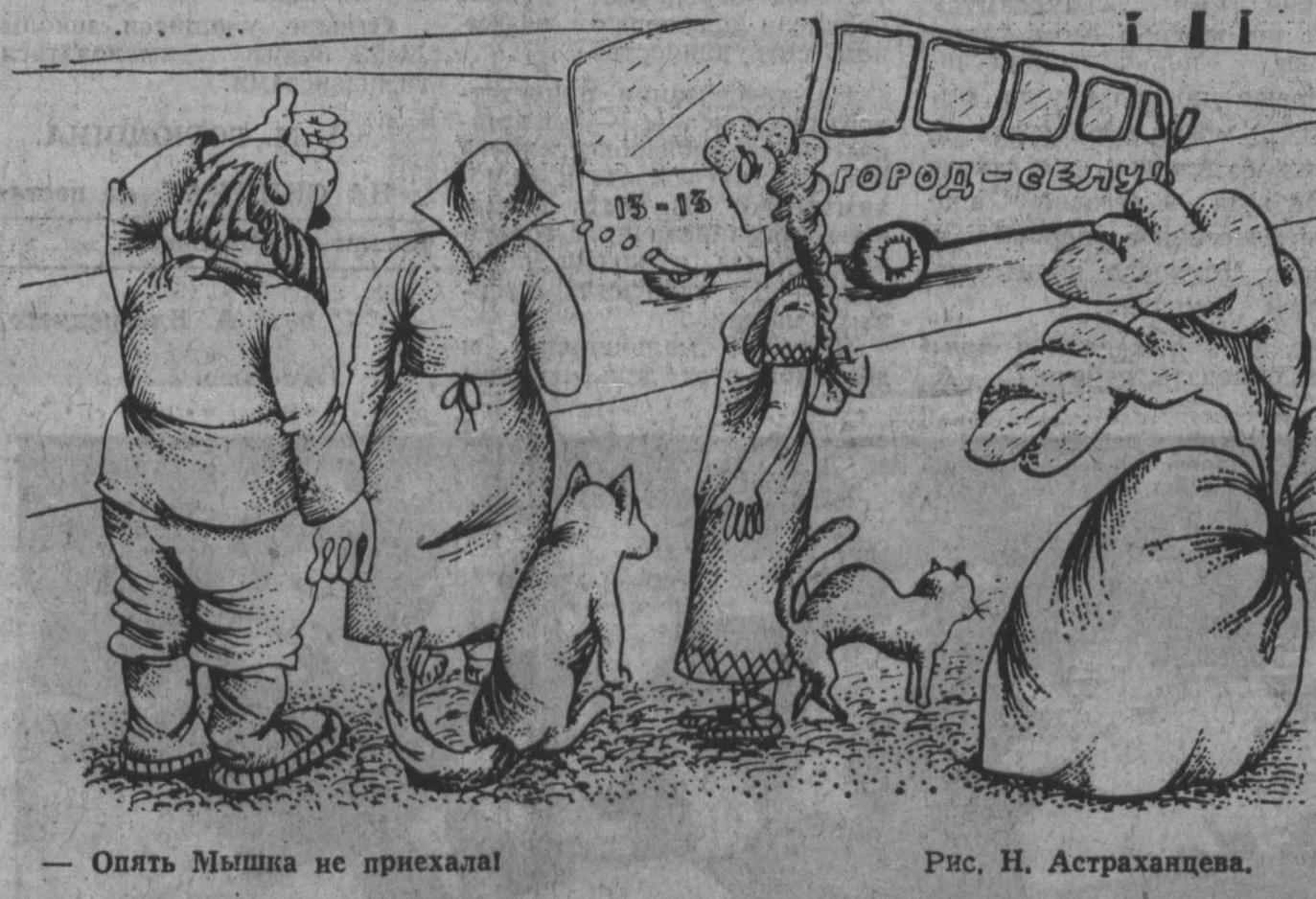
— Опять Мышка не приехал! Рис. Н. Астраханцева.