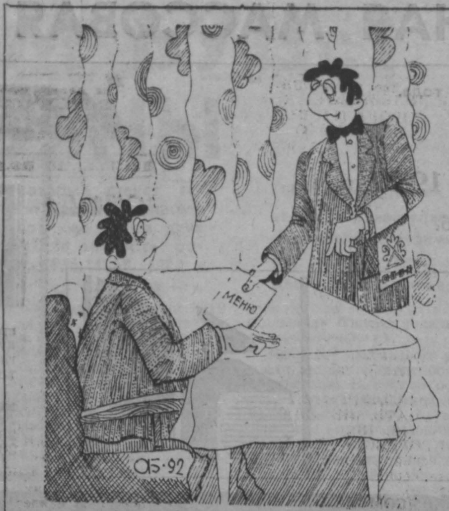
— Прежде чем ознакомиться с меню, я бы хотел видеть ваш кошелек.