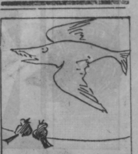
—Добылась своего. Рис. И. Сашина.

В. СИРИН, горный мастер шахты «Первомайская», депутат городского Совета, г. Березовский.