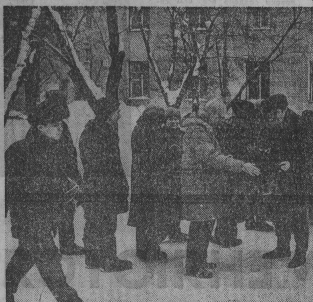
Бесконечные очереди — едва ли не самая главная примета нашего времени.