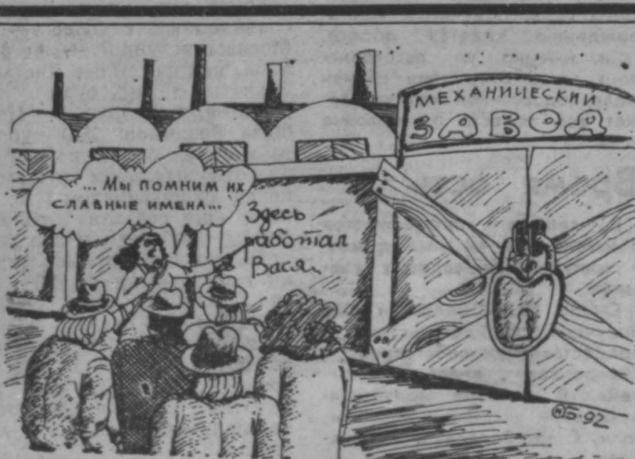
Рис. Н. Астраханцева.

(Во вчерашнем номере эта статистическая таблица была напечатана без расшифровки данных. Просим извинения у читателей).