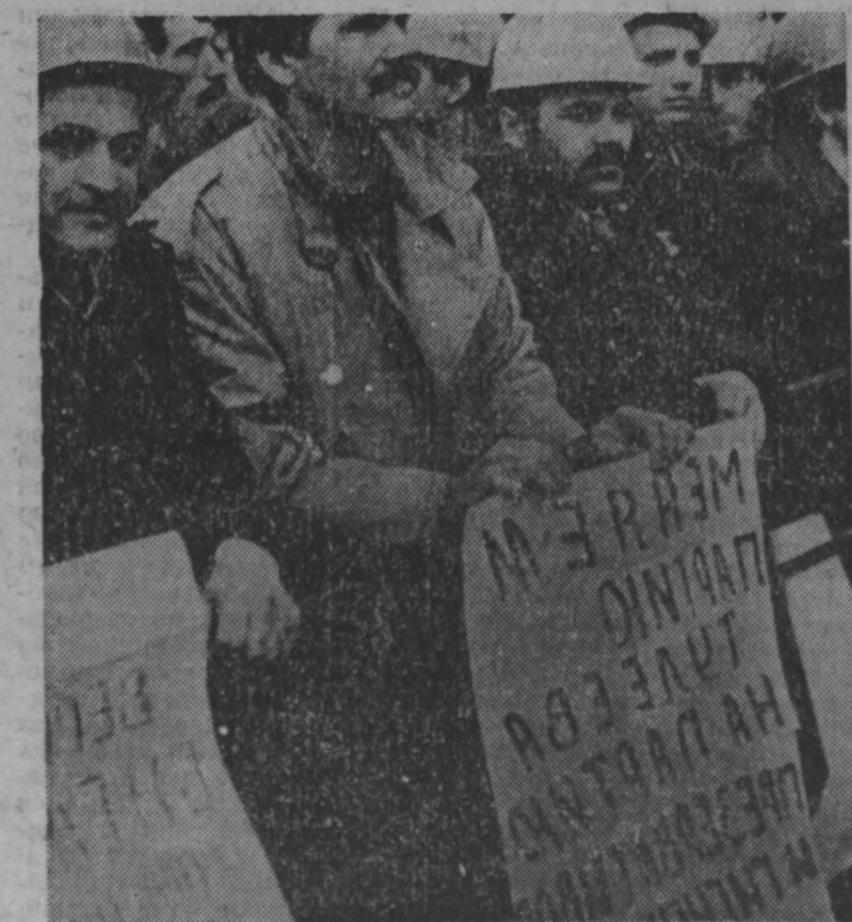
Пикетчики из Кузбасса у Спасских ворот Кремля во время VII Съезда народных депутатов Российской Федерации. Судя по плакатам, их политическая «культура» на высоте. г. Киселевск.