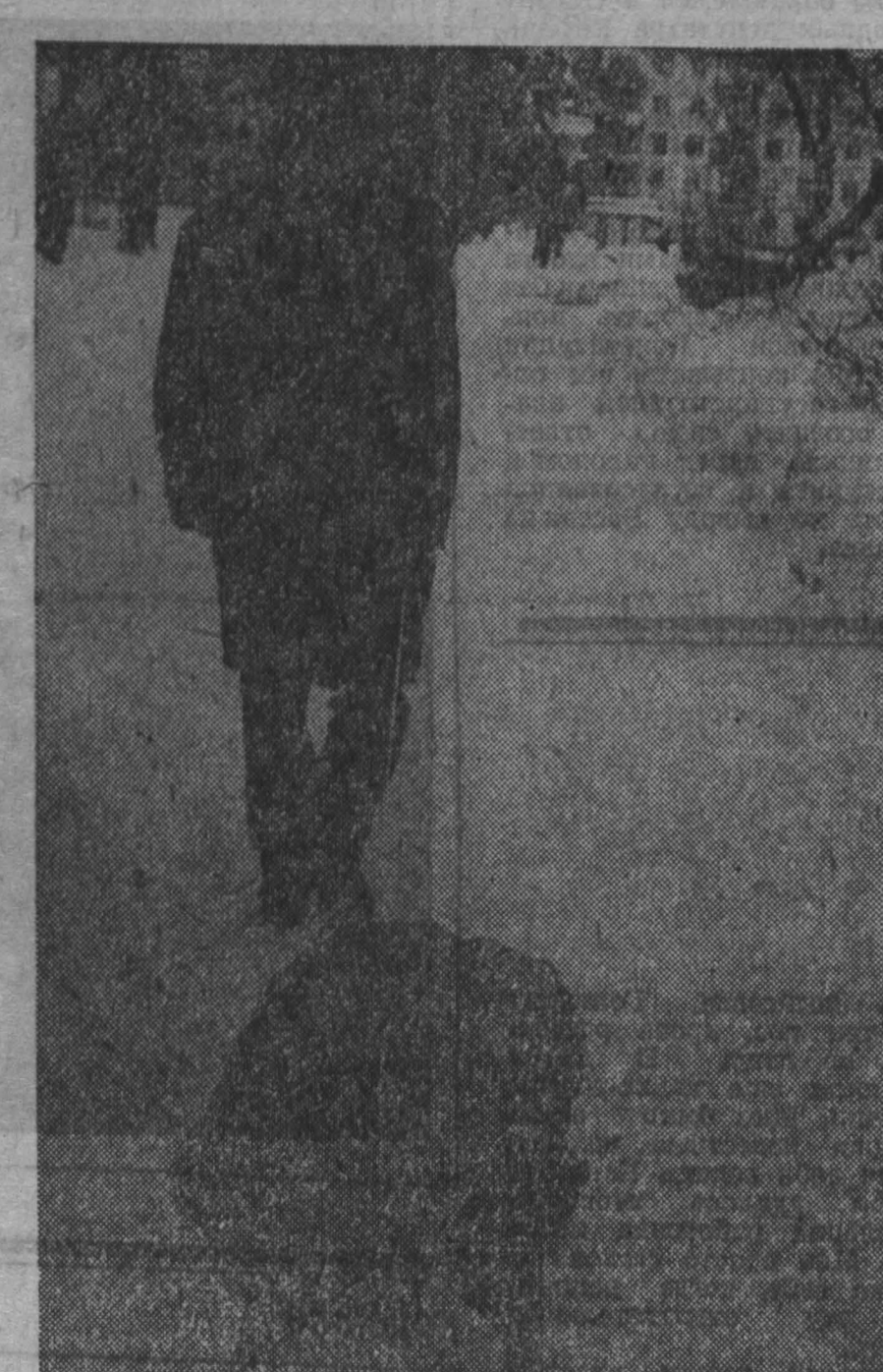
Занос карман не тянет. г. Кемерово.