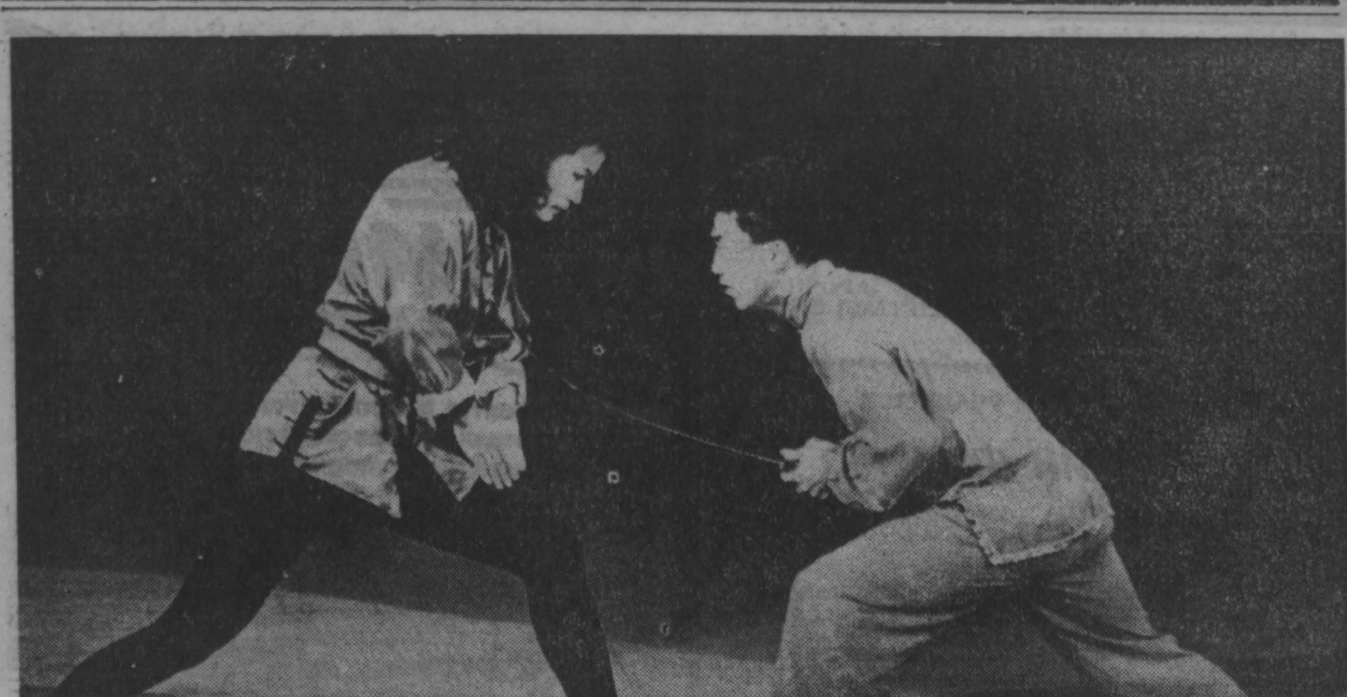
Гости — Кузбасс