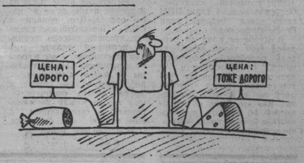
Рис. М. Ларичева.