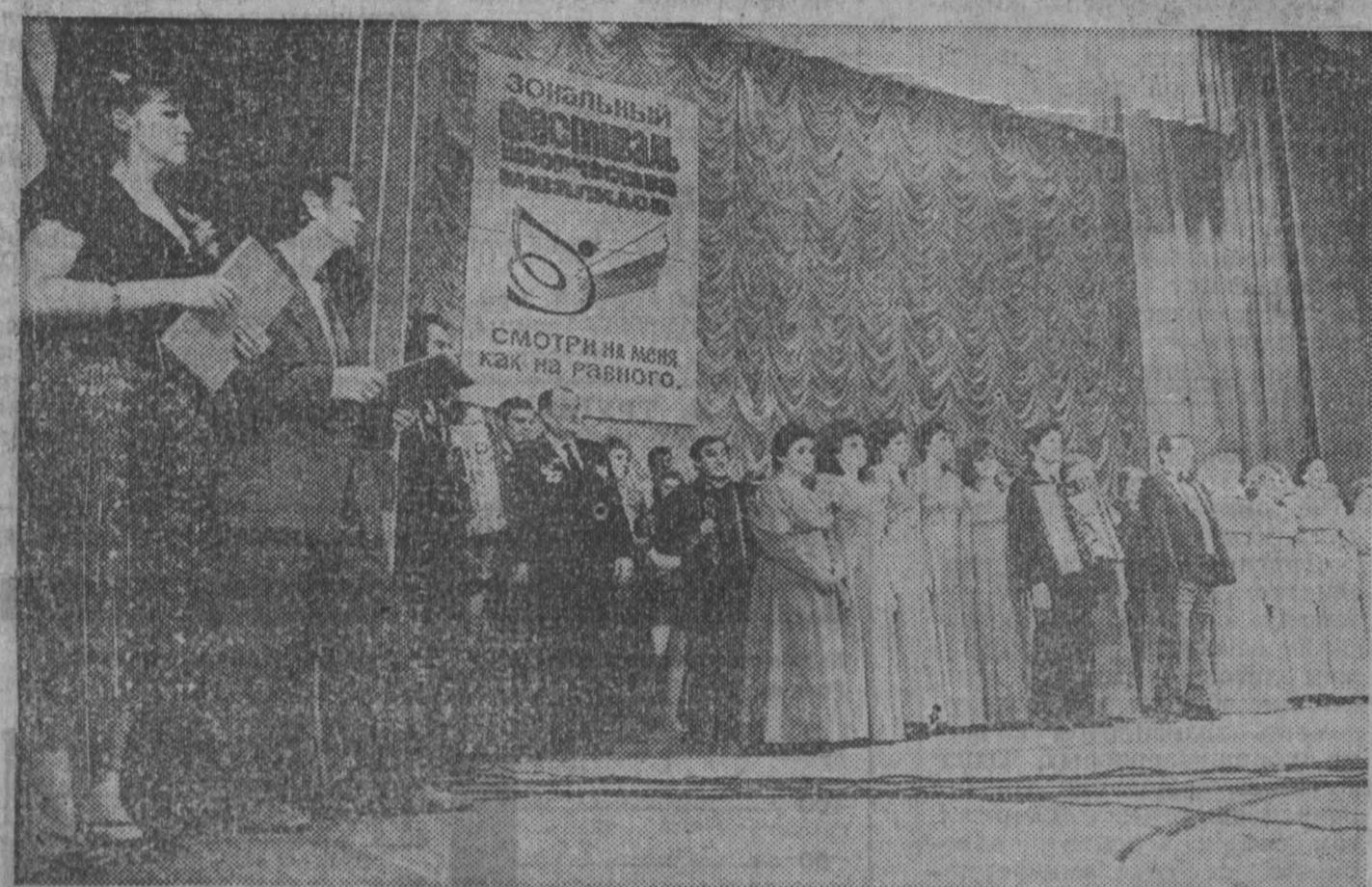
крась, республик Сибир и Дальнего Востока. Как парадоксально это звучит, но главной отличительной чертой фестиваля инвалидов был оптимизм. Поразила вера этих людей: не поддающихся недугам, в силу му-

Три дня шел в Кемерове фестиваль. Во Дворце культуры ВОГ была развернута выставка прикладного творчества, и жюри определило лучшие работы, назвав имена лауреатов. А открылся фестиваль в Большом зале филармонии концертом коллективов Кемеровской области. За эти три дня выступили на сцене представители пятнадцати областей,