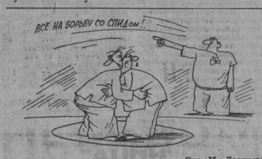
ВСЕ НА БОРЬБУ СО СПИДОМ!