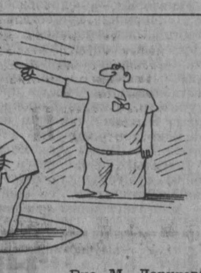
Рис. М. Ларичева.