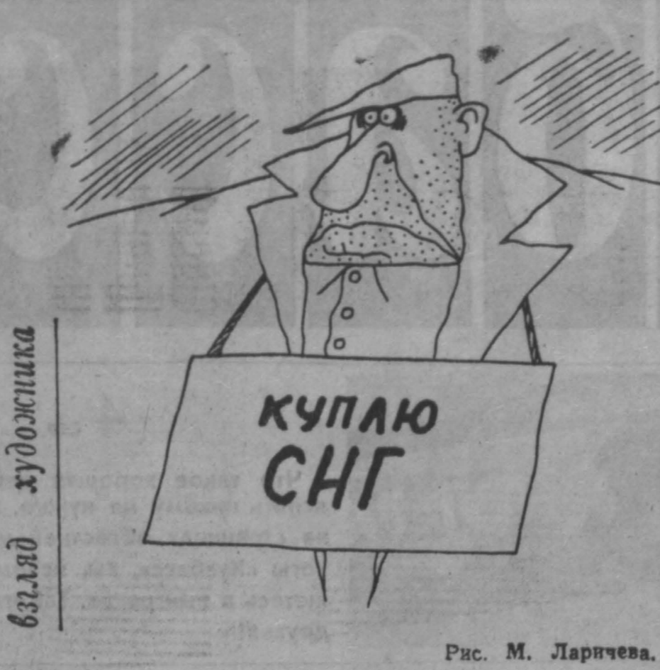
Рис. М. Ларичева.