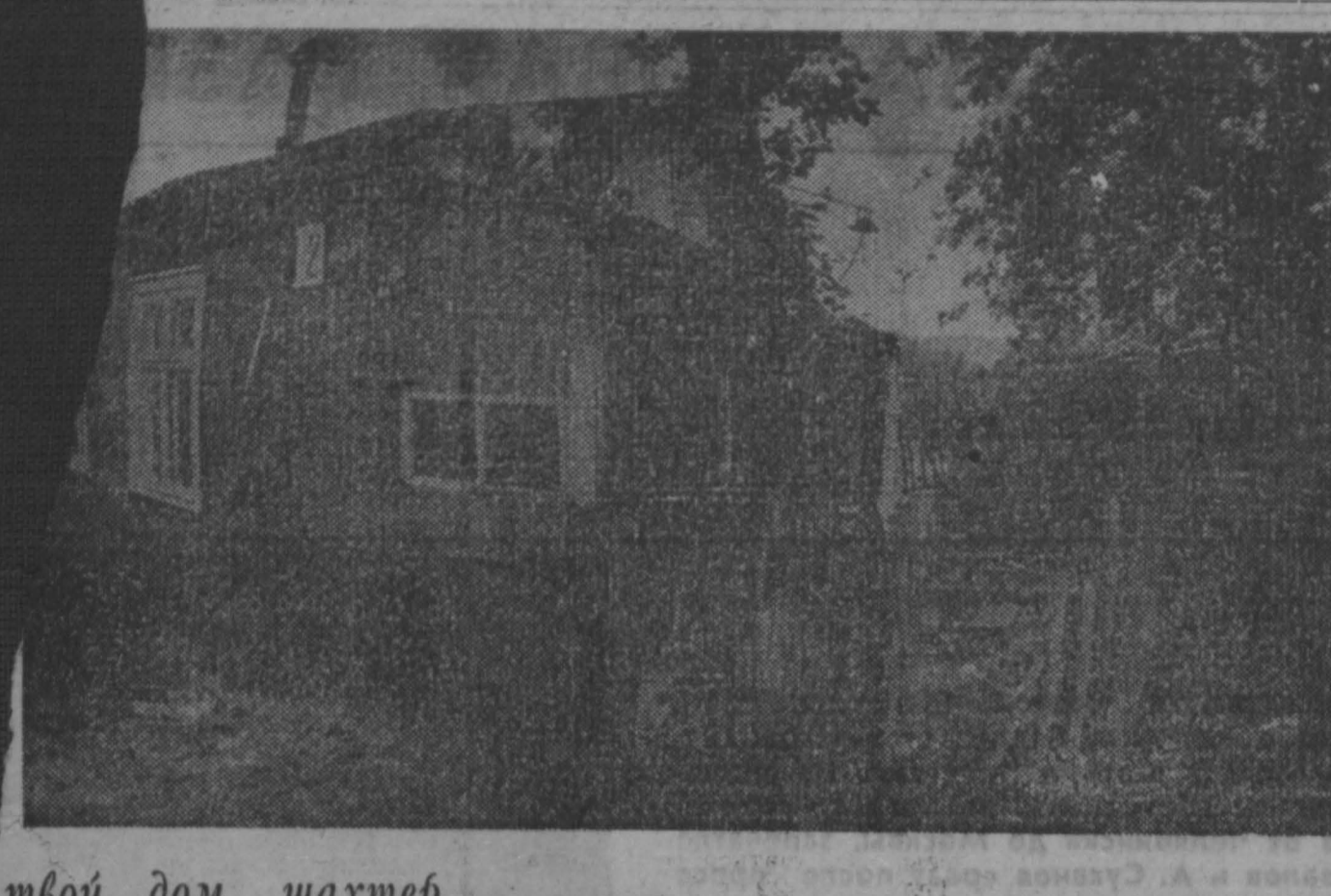
твой дом, шахтер