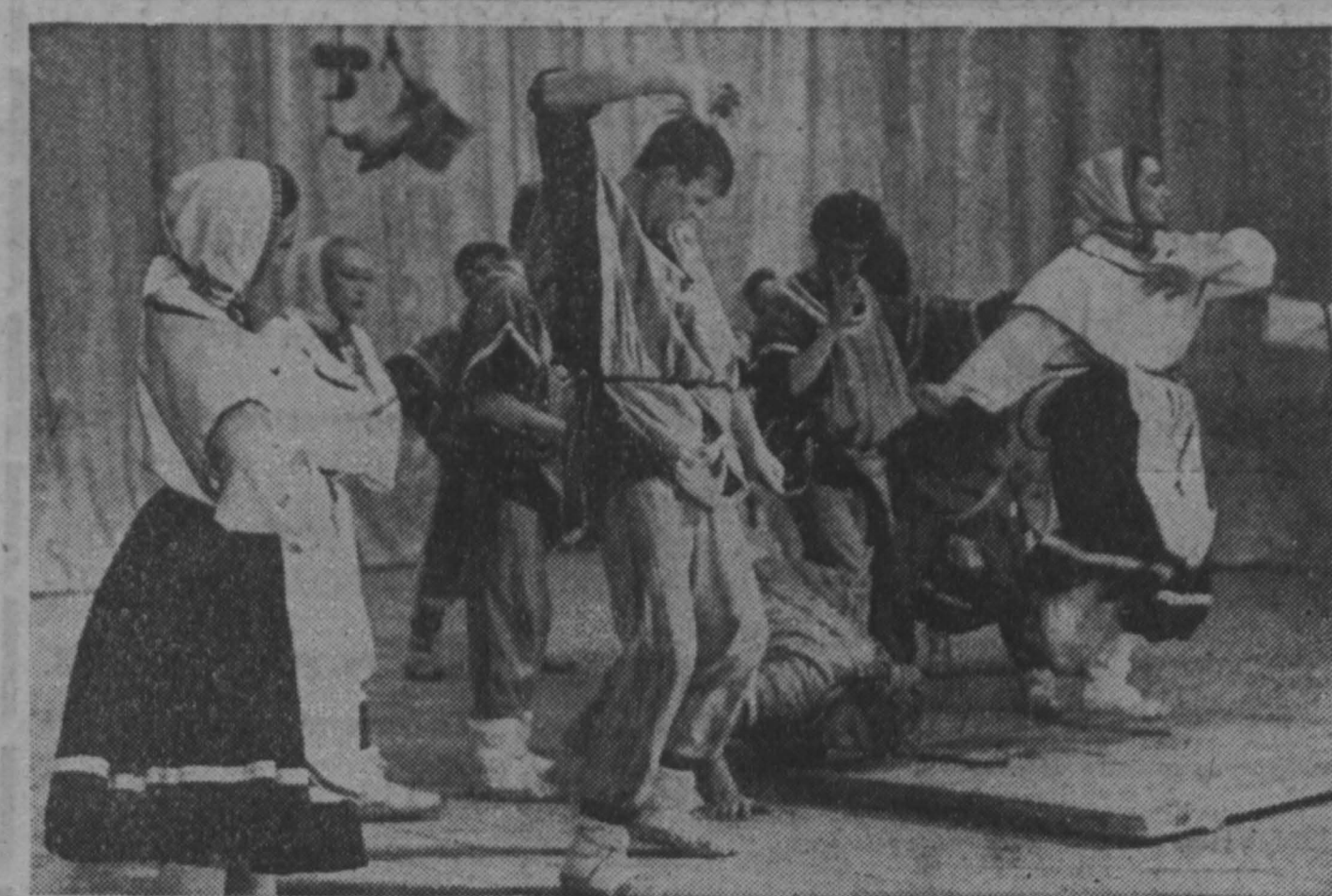
Международная неделя искусств

— Какая ответственность установлена при отказе от регистрации в Пенсионном фонде страхователя? — При отказе от регистрации с работодателем взыскивается 10 процентов причитающихся к уплате сумм страховых взносов в Пенсионный фонд. — Отказом от регистрации считается непредставление работодателем или иным плательщиком страховых взносов заявления о регистрации по истечении месяца после его письменного предупреждения об этом уполномоченным фонда. Уведомление направляется плательщику по адресу, который указан при регистрации в налоговой инспекции. Месячный срок начинает исчисляться со дня отправки уведомления.