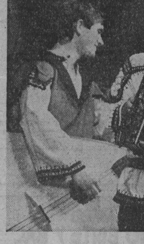
Международная неделя искусств