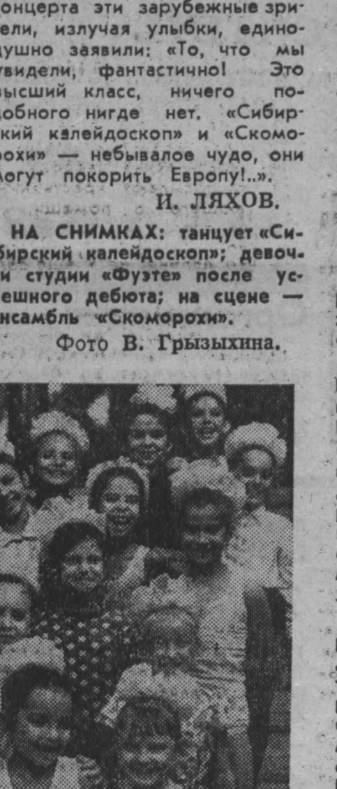
Международная неделя искусств