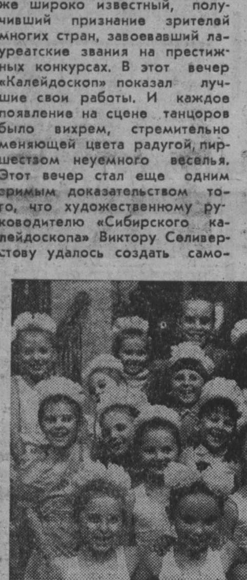
Международная неделя искусств