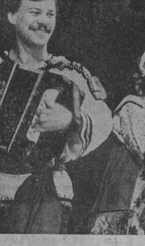
Международная неделя искусств