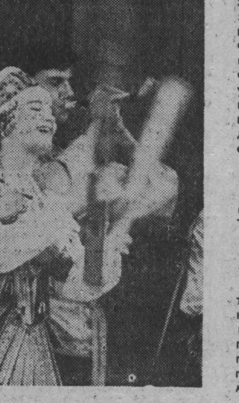
Международная неделя искусств