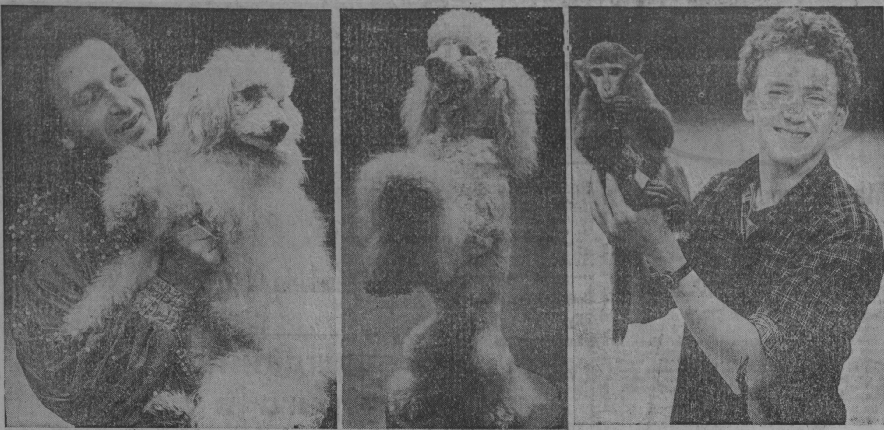
на арене цирка