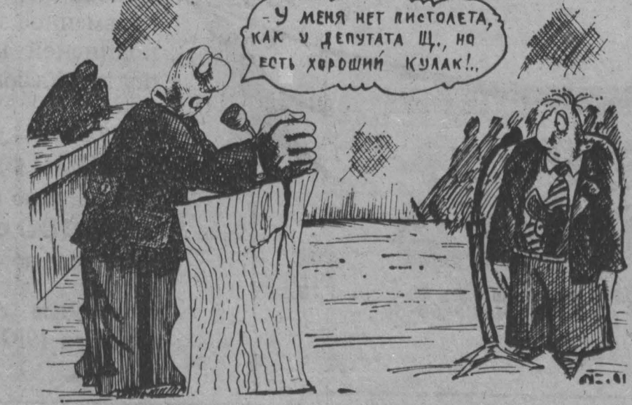
Рис. Н. Астраханцев

Мясо в Новокузнецке можно свободно купить только на рынке по 200 рублей за килограмм. А между тем в соседней его части, отоблавленной районом идет так называемая жесткая выбраковка общественного стада, а проще говоря, его поголовное истребление.