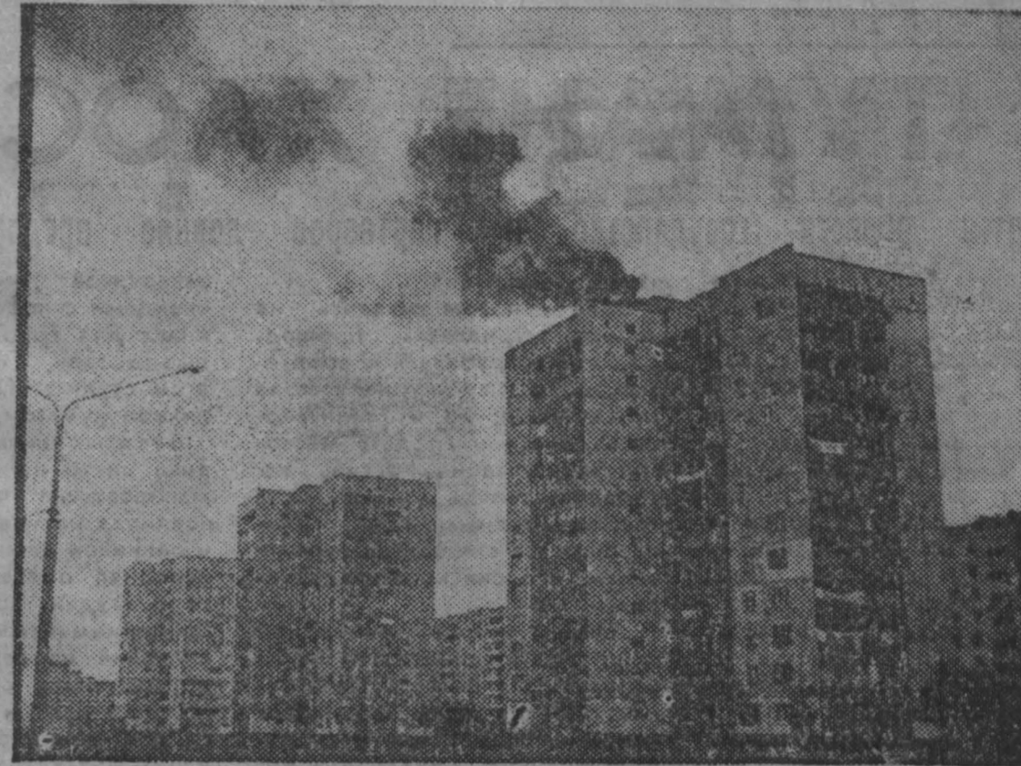
Неуменный «красный петух» в этом году нанес ущерб Кузбассу в нескольких десятках миллионов рублей. Страдают фабрики и заводы, фермы, различные предприятия, жилые дома. Основную вину в этом сам человек. От своей же бесчеловечности гибнут и взрослые, и дети. Вот снимок. Он сделан в областном центре на проспекте Химиков. Шлобова загорелась в результате нарушения сложившихся правил. На огонь, вызванный на крыше высокого дома, приехало несколько машин. Помар ликвидирован, и, к счастью, никто не пострадал, но крыша нарушена...