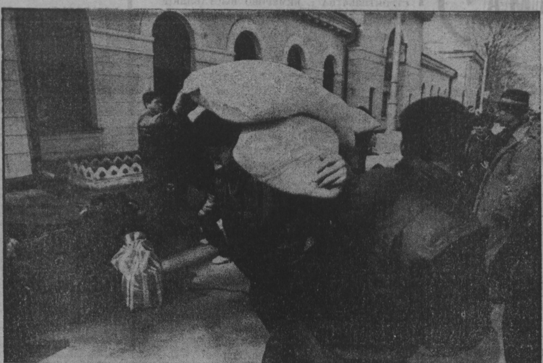
НА СНИМКЕ: «мешочники» из Китая на улицах Пограничного...