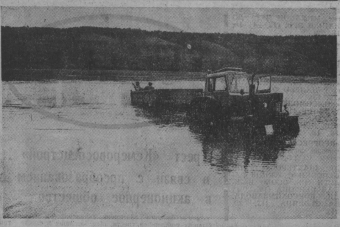
В современном мире техника всегда рядом с человеком — и в спорте, и на отдыхе.