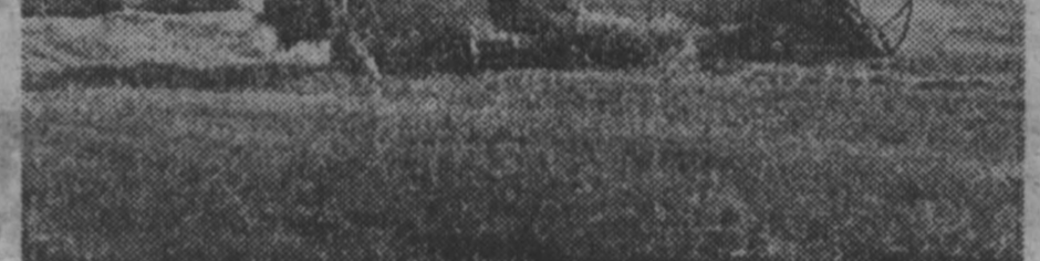
НА СНИМКАХ: мощным потоком идет зерно нового урожая.

В сельских хозяйствах Кузбасса продолжается уборочная страда. Ни один из прошедших дней уборочной не выдался легким, но сейчас наступил особенно ответственный день — началась уборка зерновых.