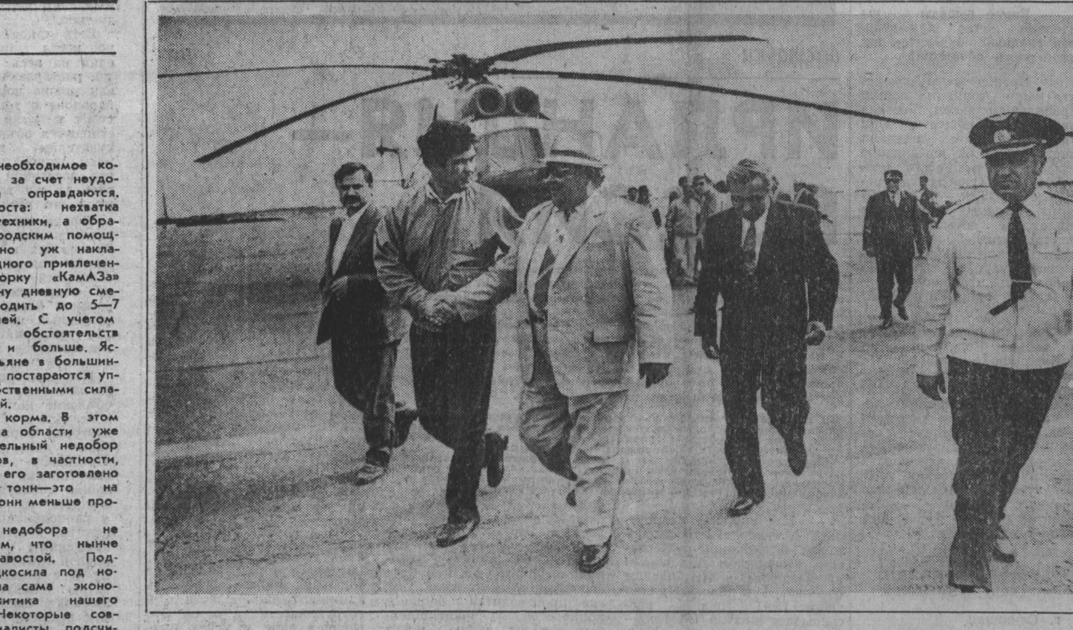
наши корреспонденты передают

Говорят, что нет ничего вечного. А если поразмыслить? Есть, оказывается, Крестовый праздник с потом на плечах и мозолями на руках, который называется хлеборобная страда. Воистину все течет и изменяется, а хлеб и крестьянский труд вечны, как сама Вселенная. Так что с праздником вас, хлеборобы, с новым урожаем!