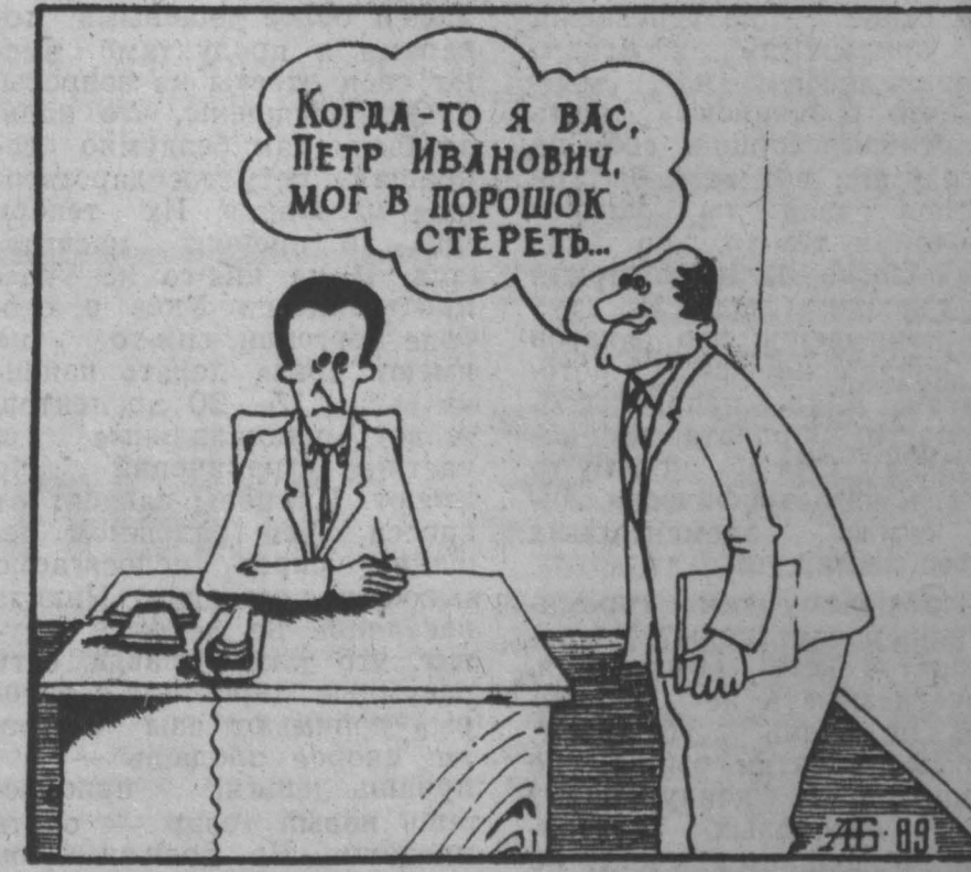
Рис. Н. Астраханцева.

Малый Совет Кировского района г. Кемерово совместно с администрацией района выделил отделу вневедомственной охраны РОВД 450 тысяч рублей на приобретение машины. Совет принял решение о квотировании рабочих мест на предприятиях и организациях района, имея в виду в первую очередь трудоустройство социально — уязвимых слоев населения: пенсионеров, инвалидов и др. На заседании также рассмотрена информация о взаимоотношениях Кемеровского городского Совета народных депутатов с районными Советами. Решено довести эту информацию до сведения всех депутатов Кировского района. Пресс-центр облвета.