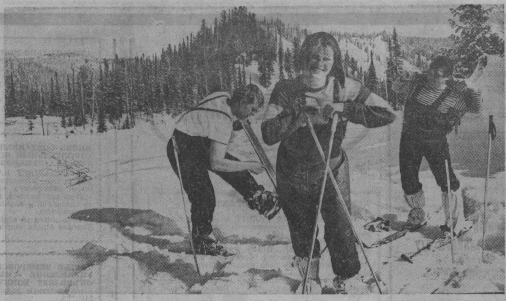
Выходной в горах.

Производственное арендное объединение «Кузбассмебельсервис» ПРОВОДИТ ПРИЕМ ЗАКАЗОВ в г. КЕМЕРОВО от населения, предприятий и организаций на ремонт мягкой мебели из материалов заказчика. Оплата как за наличный расчет, так и по перечислению.