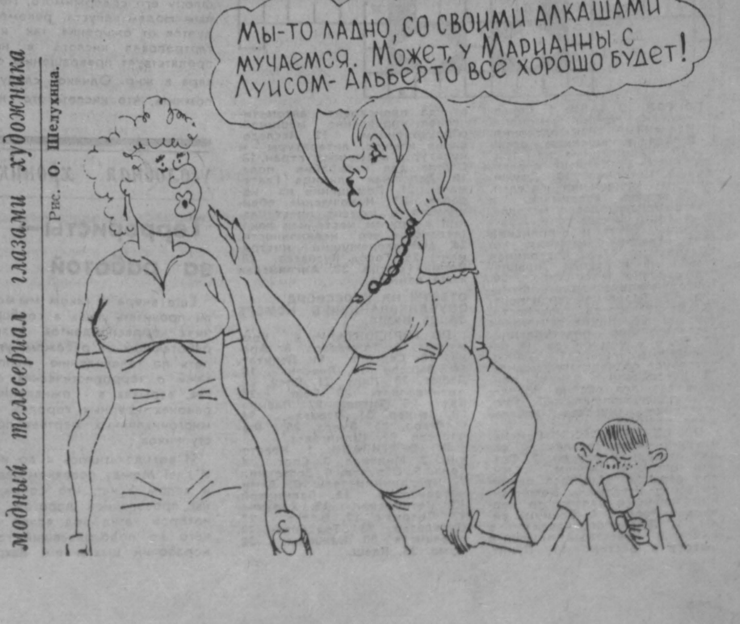
модный телесериал глазами художника