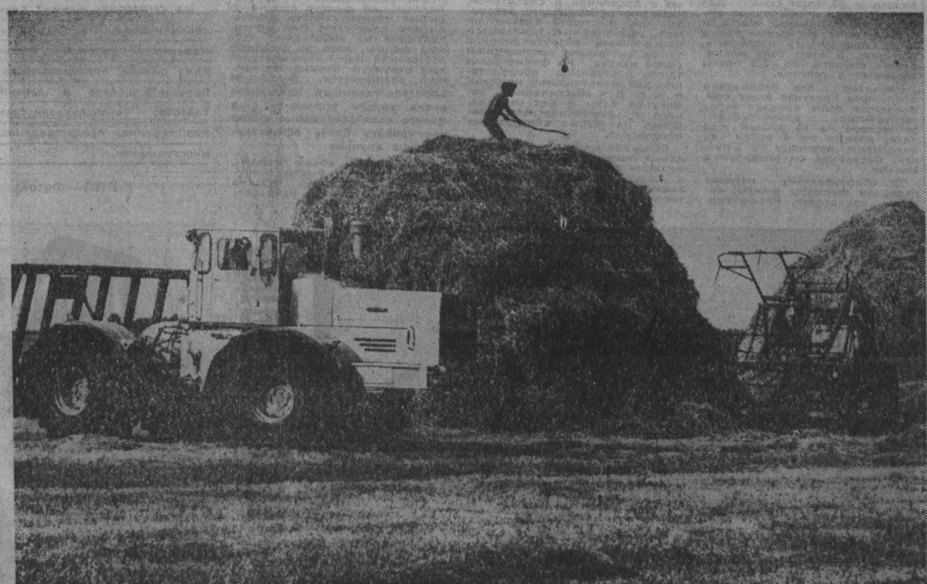
город — село

Для обеспечения общественного поголовья сеном Яйскому району требуется заготовить его 14199 тонн. По данным специалистов, травостой этого года позволяет выжать не более 8150 тонн. Согласно оценкам районного управления сельского хозяйства, на последние дни июля сена было заготовлено 4200 тонн.