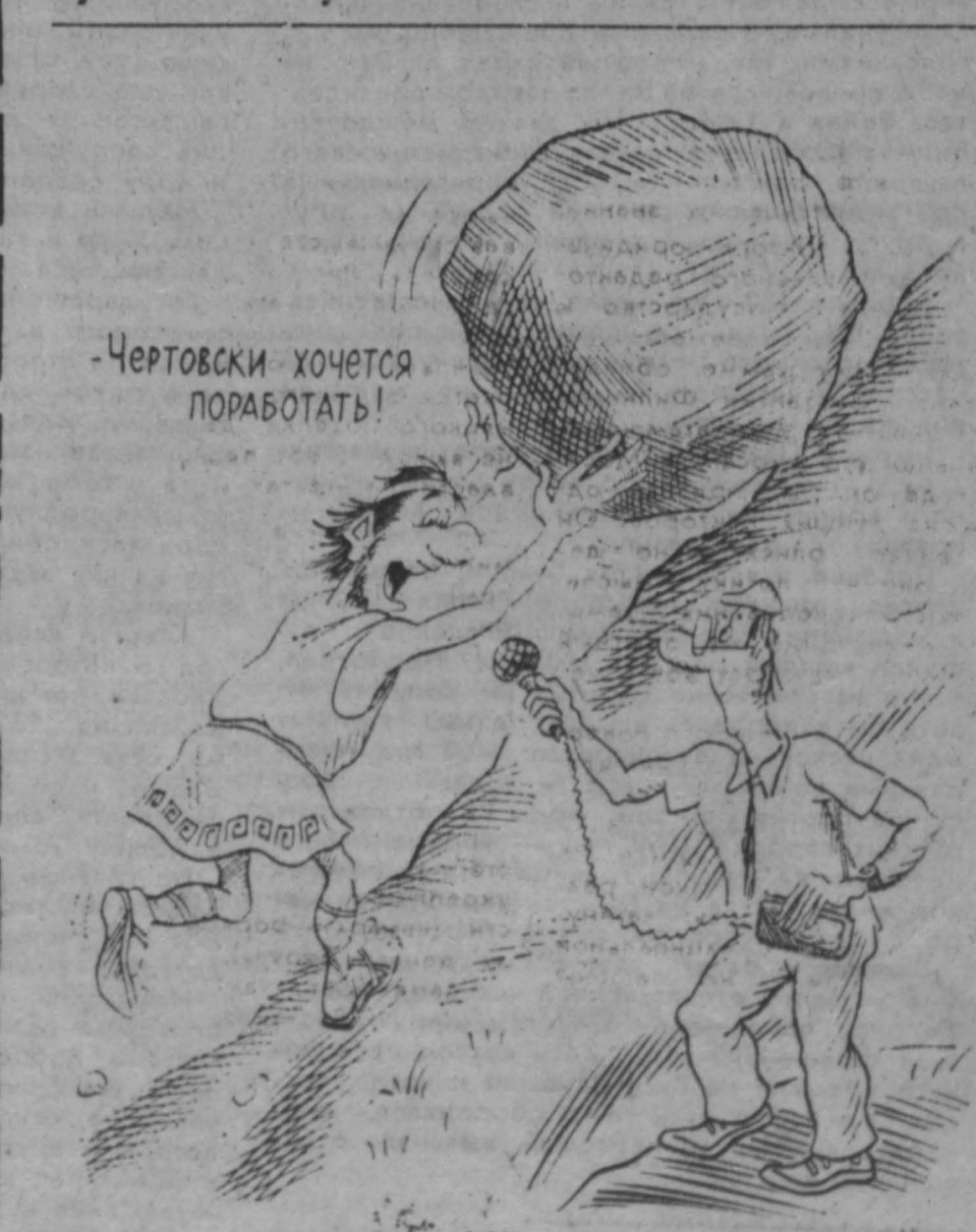
Рис. В. Мидеико.