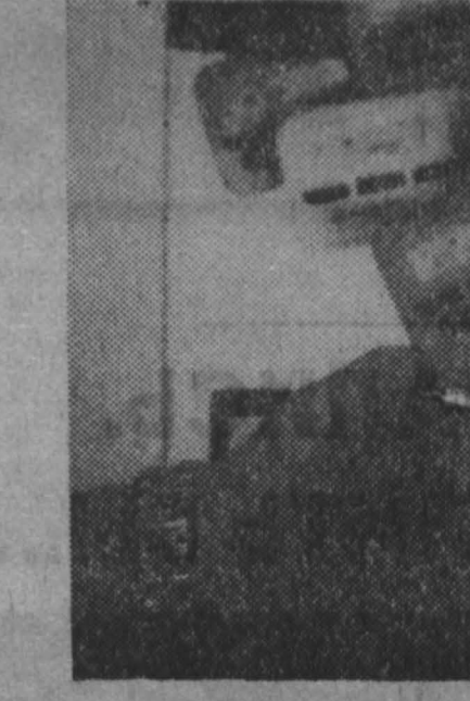
«Моторола» 201 июля 1992 г.

Основания в США 64 года назад компания «Моторола» в течение последних 50 лет удерживает ведущее место на рынке электронной аппаратуры связи.