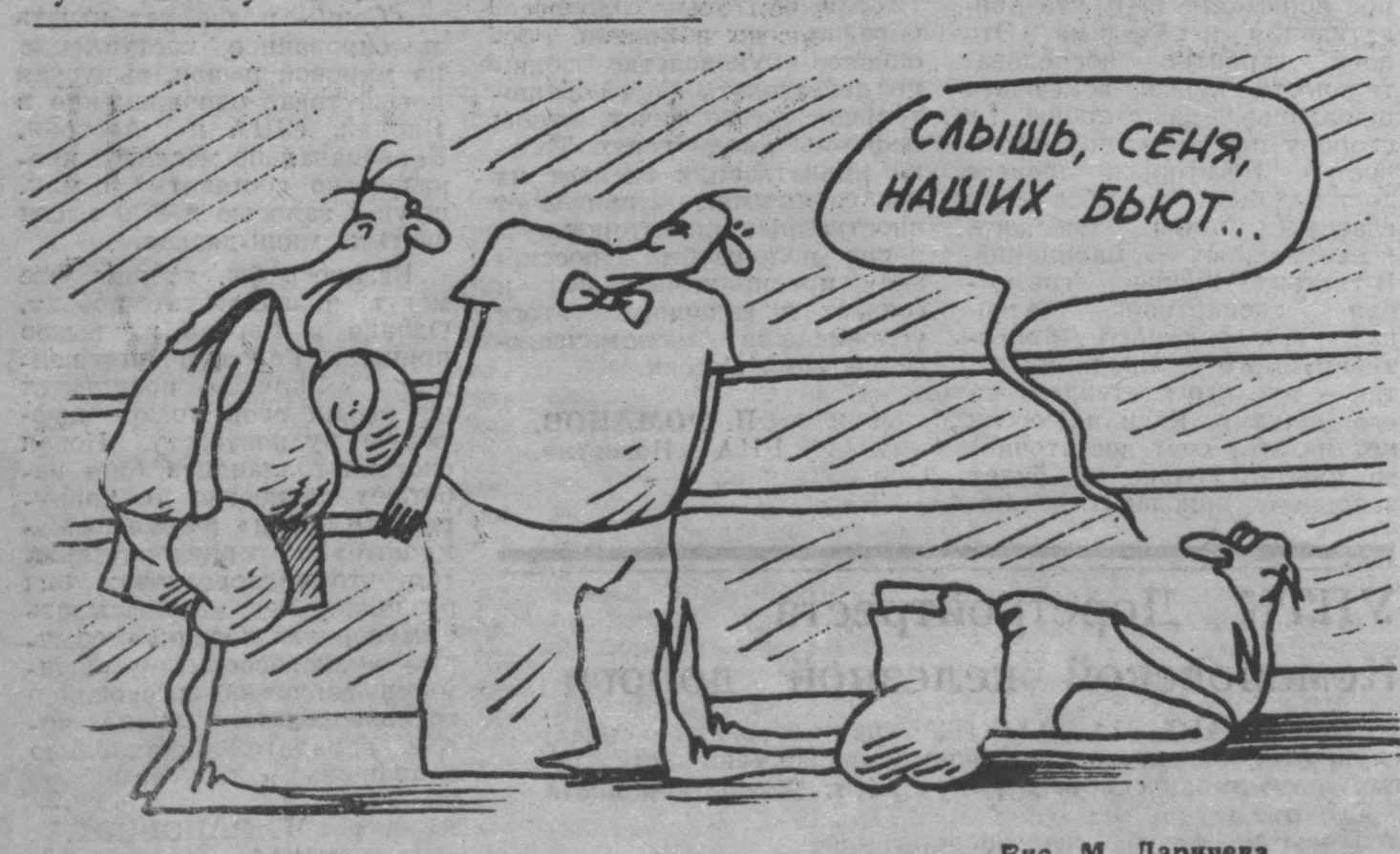
Рис. М. Ларичева.