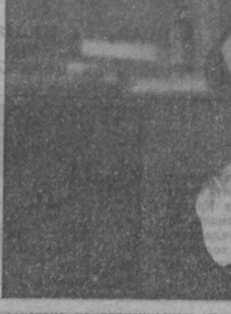
Один из них уже работает в Батави (США), другой вводится в действие в Гамбурге (Германия) и адрес третьего — подмосковный город Дубна. Особанность российского нуклотрона в том, что он стал первым сверхпроводящим ускорителем так называемых релятивистских ядер, т. е. ядер, имеющих скорость дви-