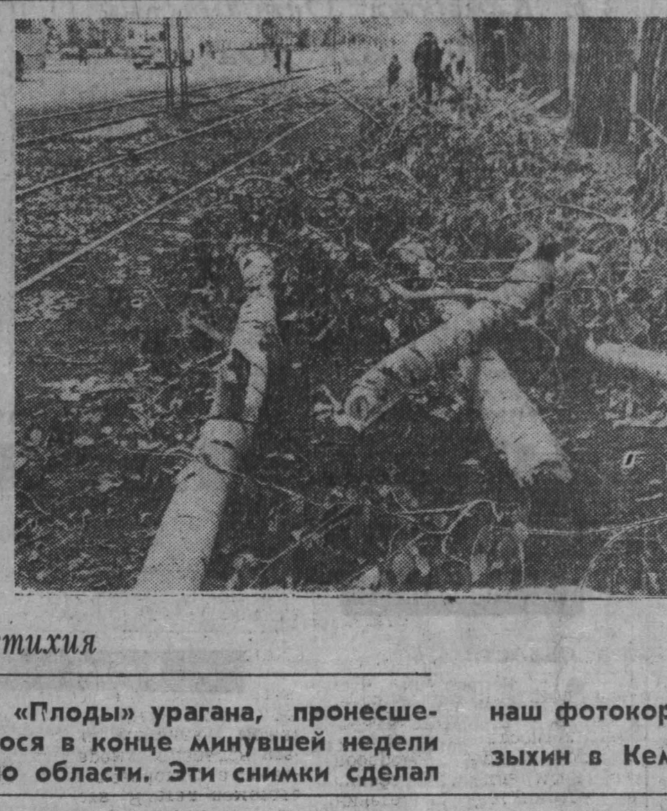
стихия «Плоды» урагана, пронесшегося в конце минувшей недели по области.