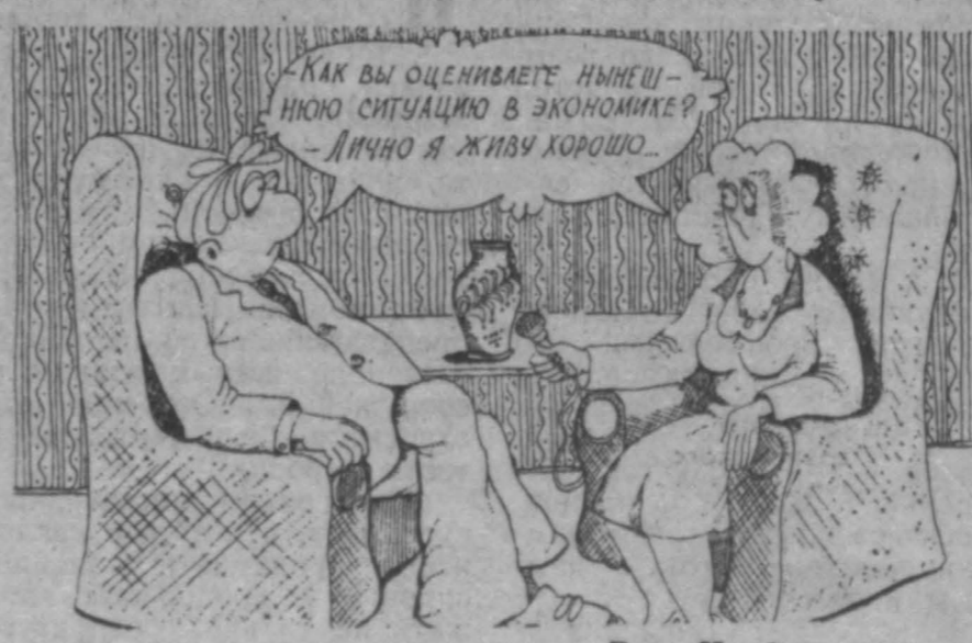
Рис. Н. Астраханцева.

В сочетании с другими гололодомками, которые задают наши власти зарубежным и внутренним деловым кругам, эта стала, видимо, решающей. Европейские финансисты, посетив Россию «зарождающимся рынком», все же высказались определенно: сегодня никаких возможностей для прямых частных инвестиций в российскую экономику нет. Значит, и впредь ходить в свободной зоне в свободном поиске милостей в столичных кабинетах.