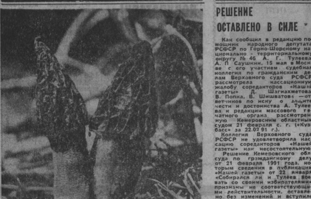
У любителей «тихой» охоты — грибов — начался новый сезон. Появились первые весенние грибы — сморчки. У нас они на любителя, а за рубежом за вкус и аромат их ценят наравне с борозниками.

ПО ВЕРТИКАЛИ: 1. Ассистент. 2. Винт. 3. Заслуга. 4. Ангустия. 5. Штандарт. 6. Рядовой. 7. Вена. 8. Кавалерия. 12. Таварисия. 13. Огноранчик. 16. Битва. 17. Огонь. 20. Монорельс. 22. «Настствие». 24. Лаутини. 25. Павлинок. 26. Парают. 27. Отказ. 30. Штаб. 32. Гимн.