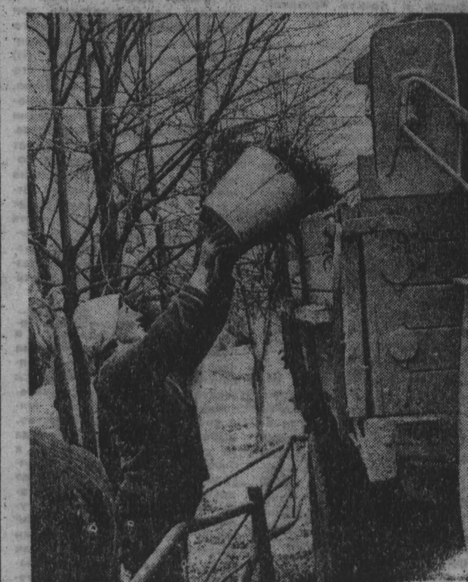
НА СНИМКАХ: на улицах областного центра в день Ленинского субботника.

Замисала Г. СОЛОДОВА, корр. «Кузбасса», г. Междуреченск.