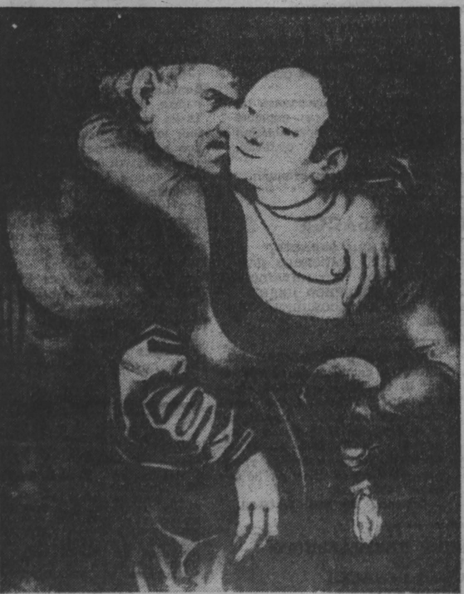
ЧЕХО-СЛОВАКИЯ. Все новые музеи становятся жертвами дедовщины. Из Прагской национальной галереи исчезла картина Лунаса Кранаха-старшего «Влюбленный старик», написанная знаменитым немецким живописцем и графником в 1531 году. Вместо изытого полотна изобразительные мастерские выставили репродукцию с картины Рембрандта того же размера. «Влюбленный старик» оценивается в триста тысяч немецких марок.

НА СНИМКЕ: картина Лунаса Кранаха-старшего «Влюбленный старик».