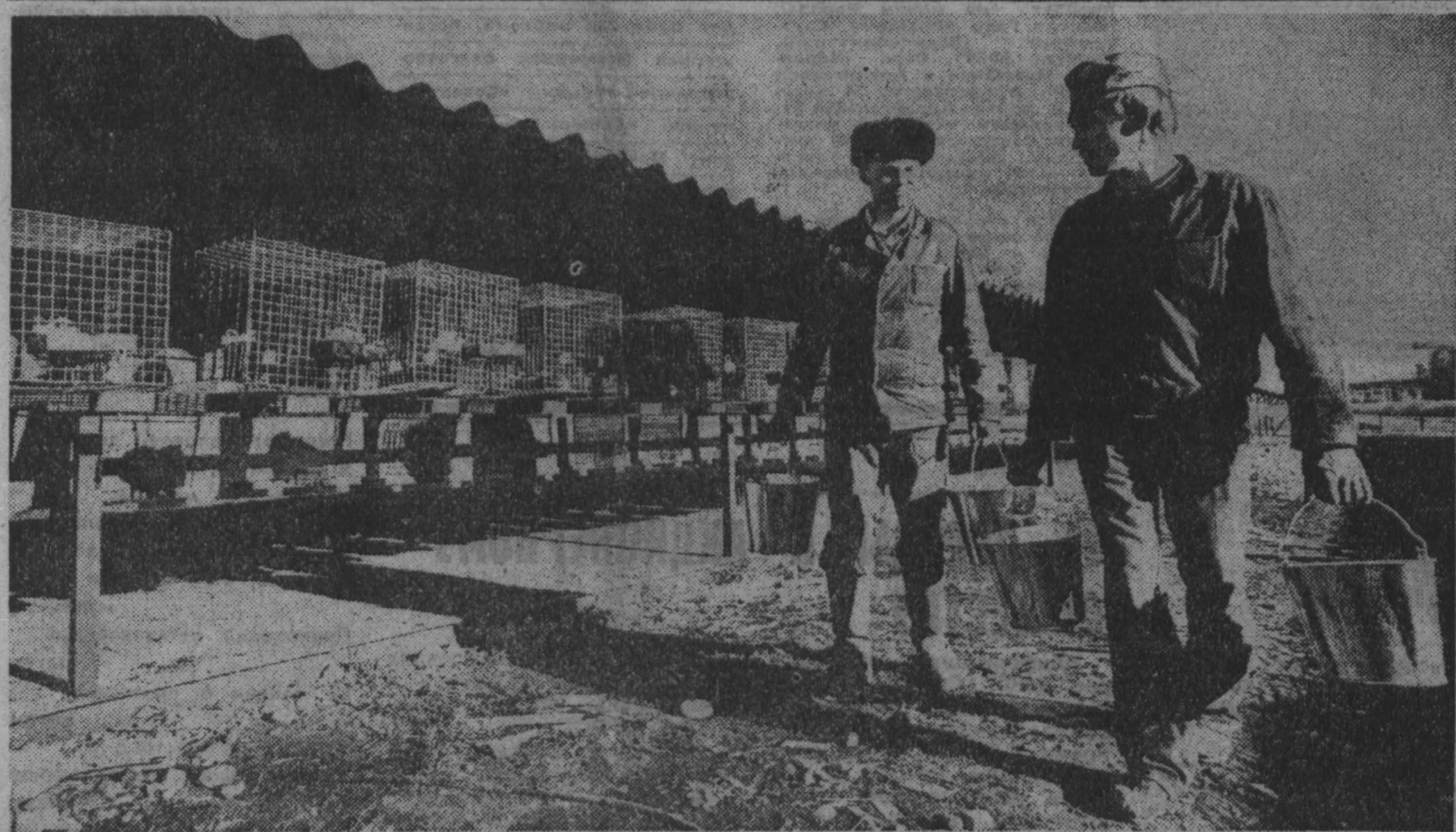
Второй год на госплемзаводе «Октябрьский» существует ферма по разведению пушных зверей. Начинили с так называемых хонориков, которые получены путем скрещивания норки с хорем. А теперь в вольерах прекрасно себя чувствуют серебристо-черные лисы, норки и хорь-фуро, которые скоро дадут потомство. НА СНИМКЕ: на ферме. Кемеровский район.