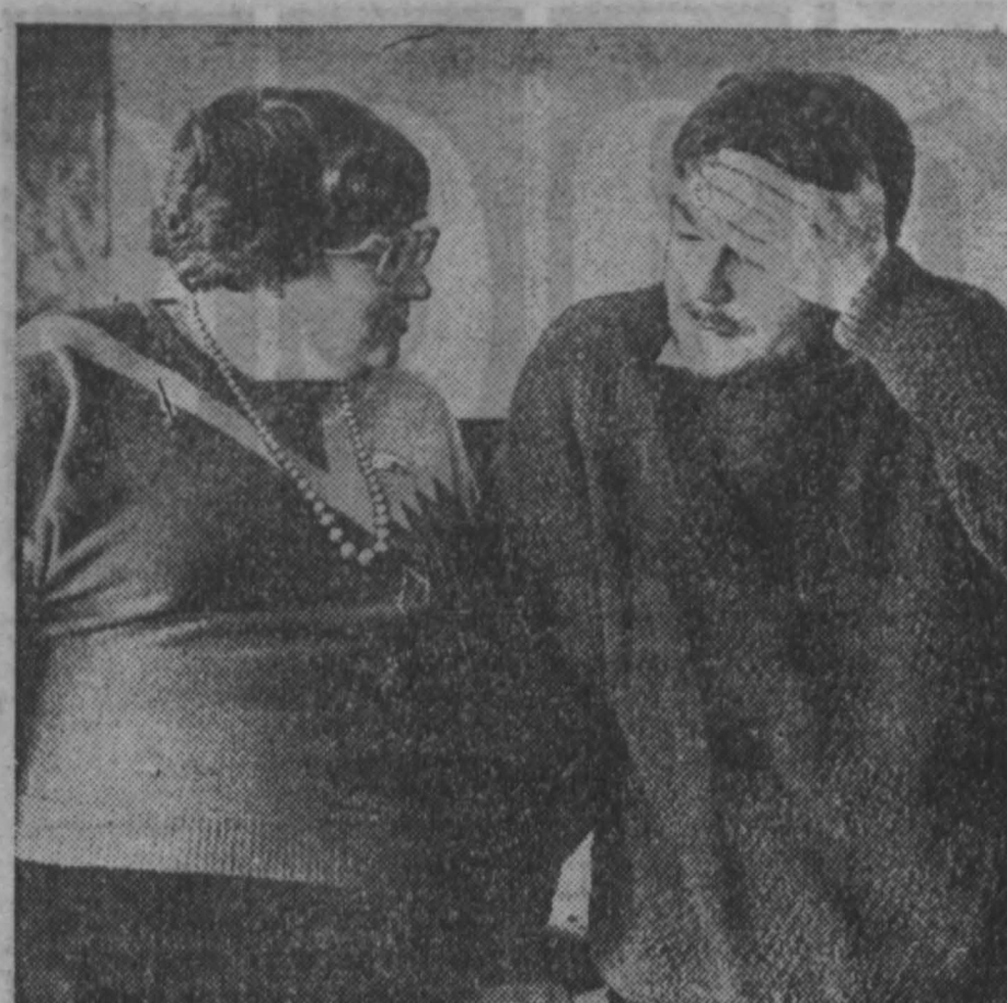
Вот и хочется спросить вас, из ДС: кто вы — защитники и рататели народа или потравляющие головы?