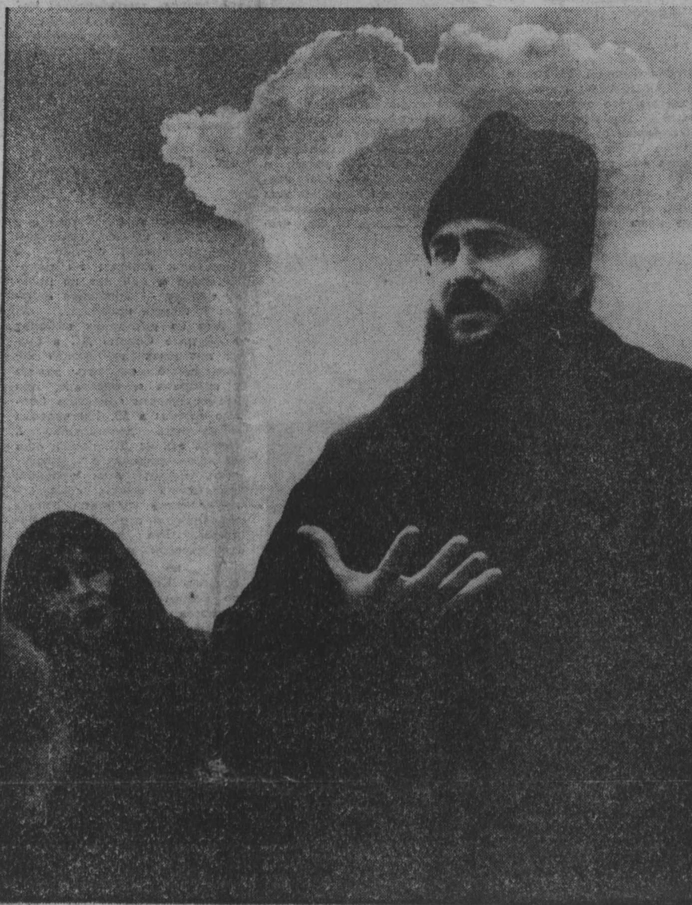
фотоконкурс «Мир и мы»