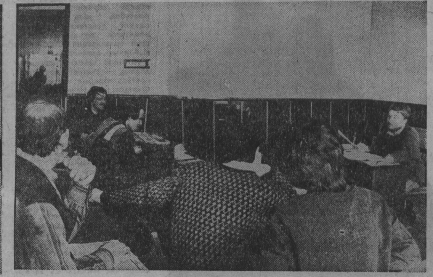
КУЗБАСС 26 апреля 1991