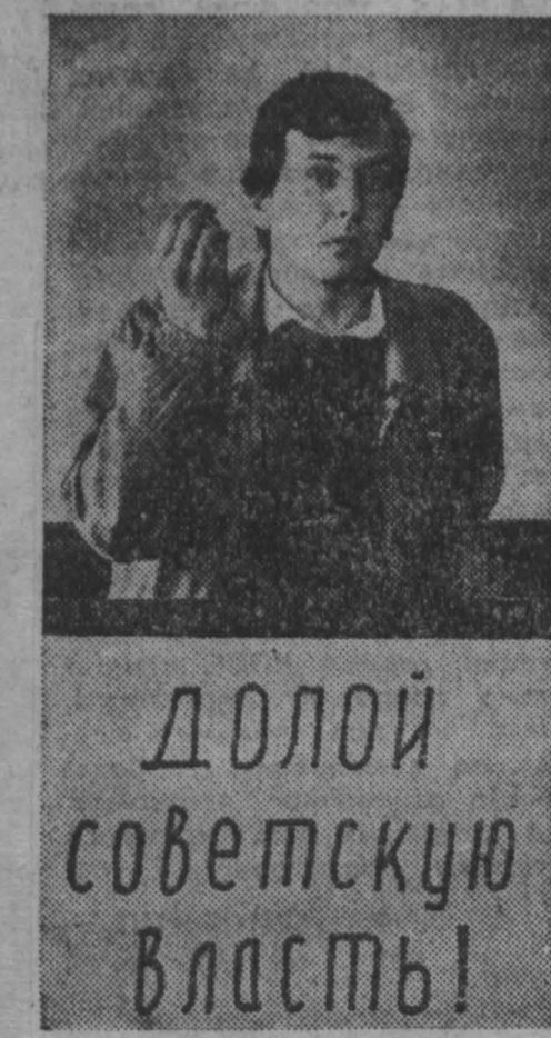
ДОЛОЙ советскую власть!

Эти снимки сделаны во время заседания координационного совета ДС, на котором и принята листовка.