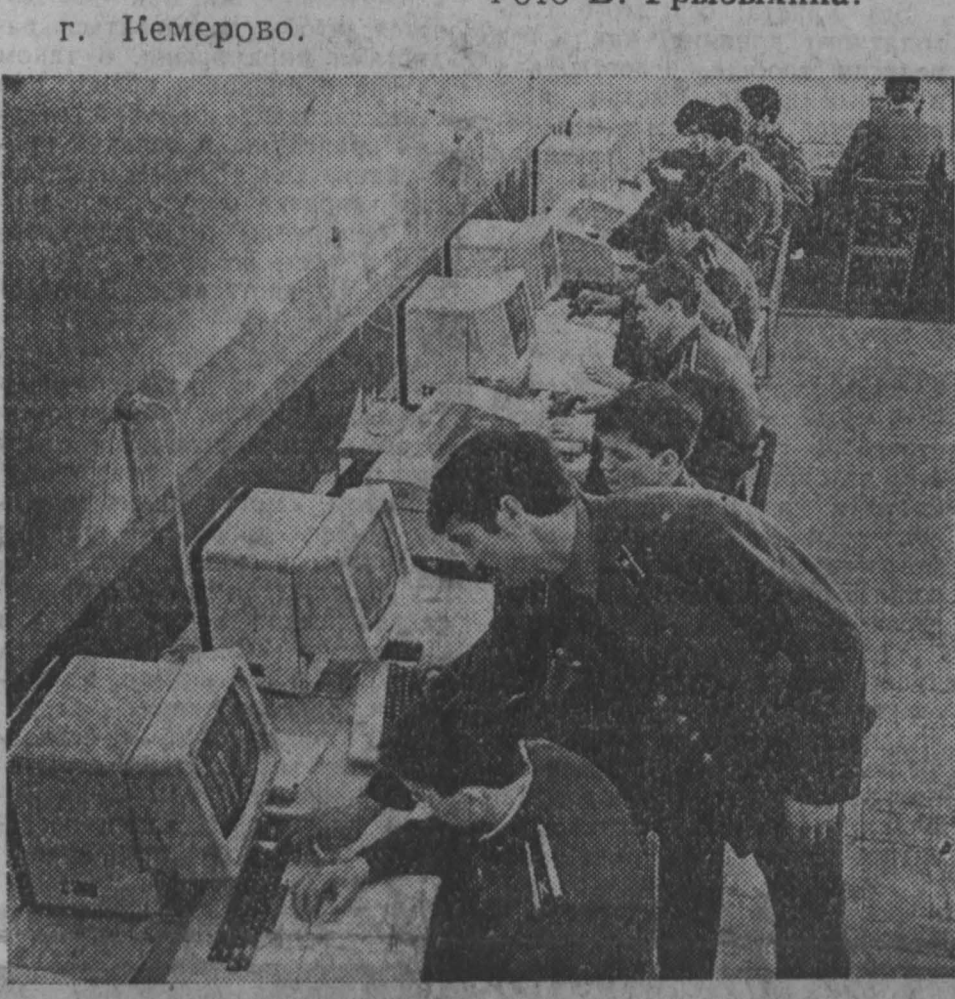
г. Кемерово.