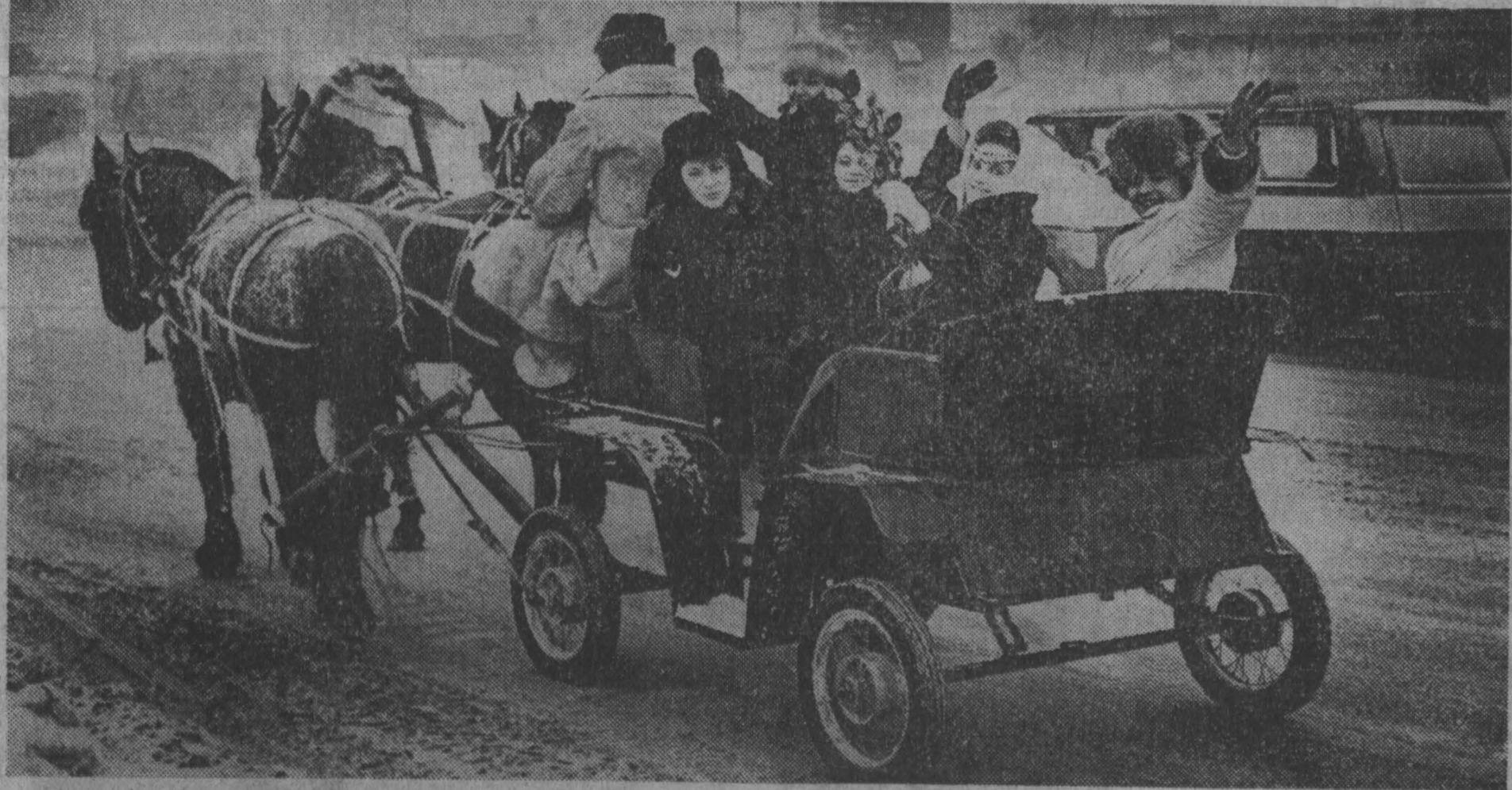
В канун нового года на улицах областного центра можно было увидеть необычную картину: среди множества спешащих автомобилей грациозно бегающую тройку лошадей и карету на колесах, а в ней — молодые и красивые парма-