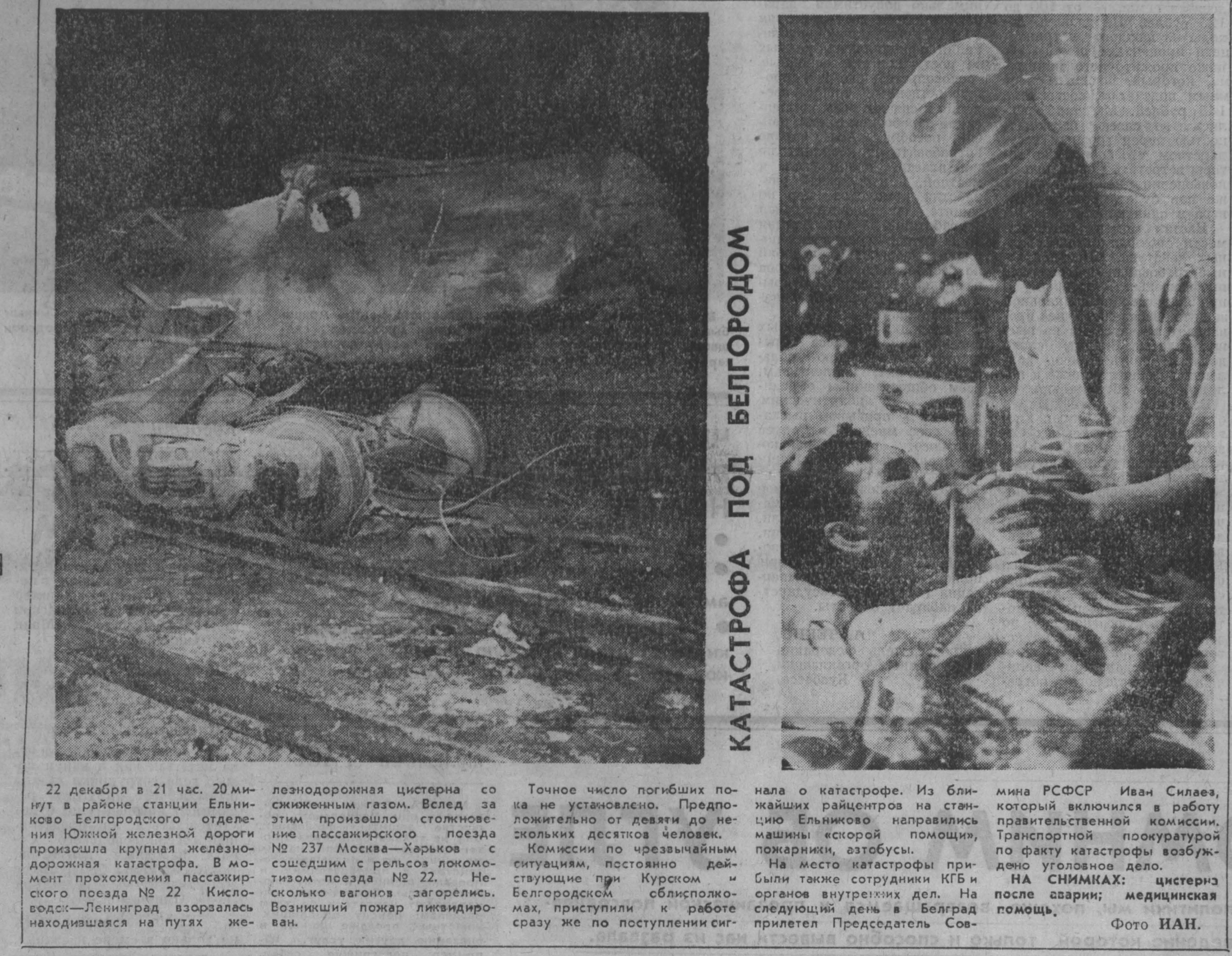
22 декабря в 21 час. 20 минут в районе станции Ельниково Белгородского отделения Южной железной дороги произошла крупная железнодорожная катастрофа. В момент прохождения пассажирского поезда № 22 Кисловодск-Ленинград взорвался находившаяся на путях железнодорожной цистерна со сжиженным газом. Вслед за этим произошло столкновение пассажирского поезда № 237 Москва-Харьков с сошедшим с рельсов локомотивом поезда № 22. Несколько вагонов загорелись. Возникший пожар ликвидировали.