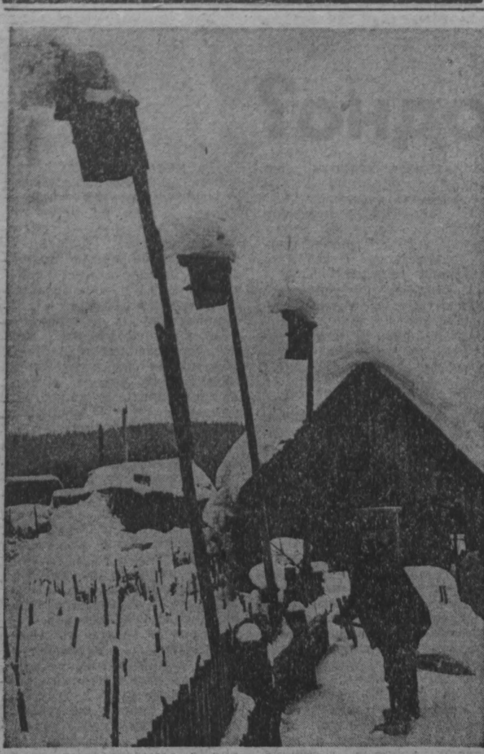
В ожидании вестей.

ДОМ КИНО «МОСКВА». Большой зал, СТЕРВЯТНИКИ НА ДОРОГАХ, две серии (10-30, 13-30, 18-30). Малый зал, ЕЩЕ ОДНА СВЯЗЬ, две серии (11, 20), КАЖДА МЕСЯЦ, две серии (14, 17). «АВРОРА». Большой зал, СТЕРВЯТНИКИ НА ДОРОГАХ, две серии (11, 13-30, 18-30, 21). Малый зал, ПУТЕШЕСТВИЕ НЕТТИ ГАНН (10-15 — для детей), КАЗЕННЫЙ ДОМ (12, 17, 19, 21-20). «ЮБИЛЕЙНАЯ». Индийский фильм ПЛАМЯ, две серии (12, 15, 18, 20-40). «КОСМОС». ИВАН ВАСИЛЬЕВИЧ МЕНЯЕТ ПРОФЕССИЮ (11, 15-20). АТАКА (15). Американский кинобонус ДЕВЯТЬ СМЕРТЕЙ НИНДЖА (11-30, 13, 13-30, 15-30, 17, 18, 19-20) — сейчас мультипрограмма), ТАКСИ-БЛОК (20-20). «ВРЕМЯ». БОЛЬШАЯ ПРОГУЛКА, две серии (14, 16-40, 19-20). «ПРОГРЕСС». ДИКИЕ ЛЕВЕДИ (12). ДУРАКИ УМИРАЮТ ПО ПЯТНИЦАМ (14, 16, 18, 20, 21-40). «ОКТАВЬ». ГОЛУБАЯ ВЕЗНА (16, 18, 20). «ЛУЧ». УНИЖЕНИЕ НА МОНАСТЫРСКИХ ПРУДАХ, две серии (12, 17, 20). ВУНДЕРКИНД (14-30). «МЕТАЛЛУРГ». В ПОЛОСЫ ПРИВОН (17, 19). «НОМОСОЛЕЦ». ЖЕНЩИНА ДИЯ (16, 18, 20). ДК имени 50-летия ОКТЯБРЯ, ДРЯНЬ (14, 16, 18-10, 20-20). ДК ШАХТЕРОВ, Киносорbonne мультфильмов ВОЗВРАЩАЮСЯ, КАПИТОШКА! (14-30). МАФИЯ В ОКЕАНЕ (16, 18, 20). ДК ПРОИЗВОДСТВЕННОГО ОБЪЕДИНЕНИЯ «АЗОТ» — ДОЛГАЯ РАЗЛУКА, две серии (16, 19). ДК КОНСОХИМЗАВОДА. НИКОГДА НЕ ГОВОРИ «НИКОГДА», две серии (17-15, 20).