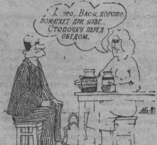
Рис. Н. Астраханцева.

Лечиться нетрадиционно. Что такое питаться «по Семейной»?