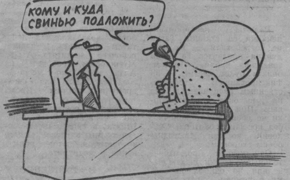
Рис. Н. Астраханцева.